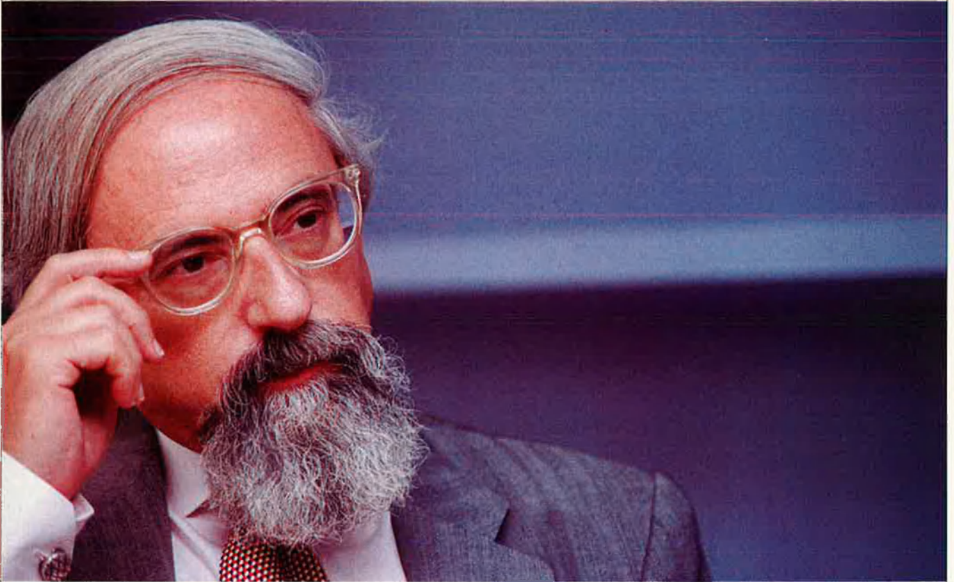
“La nostra societat pateix un trauma: una anticultura ancestral, una anticultura que ha estat fomentada al llarg de 40 anys.”