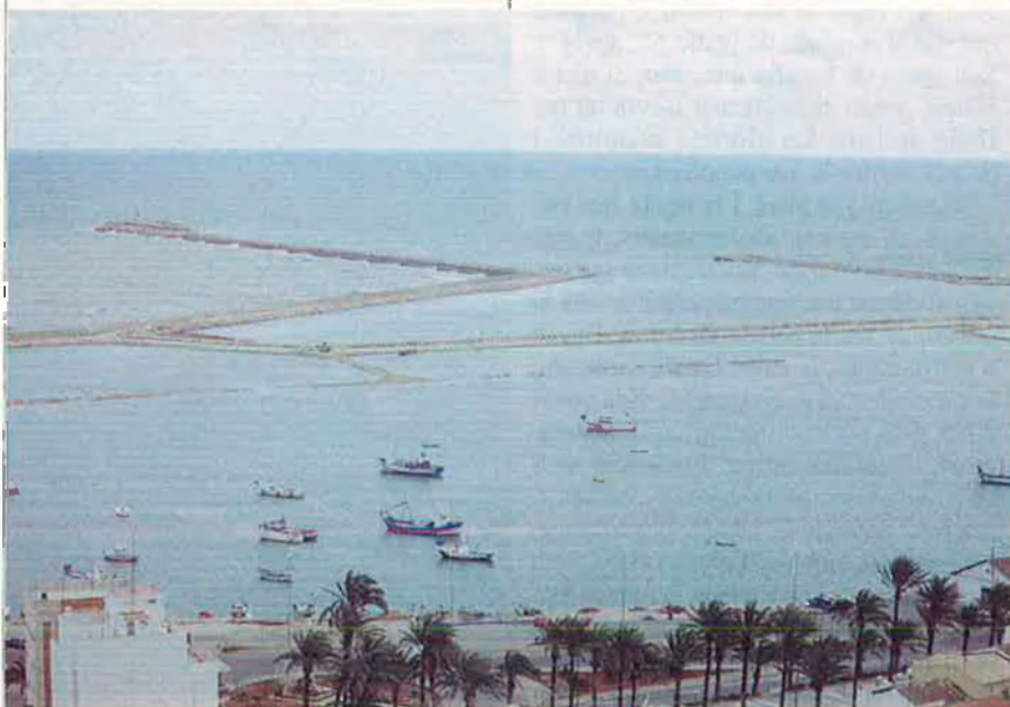
"Dènia. De port en forma d'embut i amb baixos perillosos a la vora".

Un dia de navegació, i ja hem arribat, evidentment si el Rei Barbut vol i ens