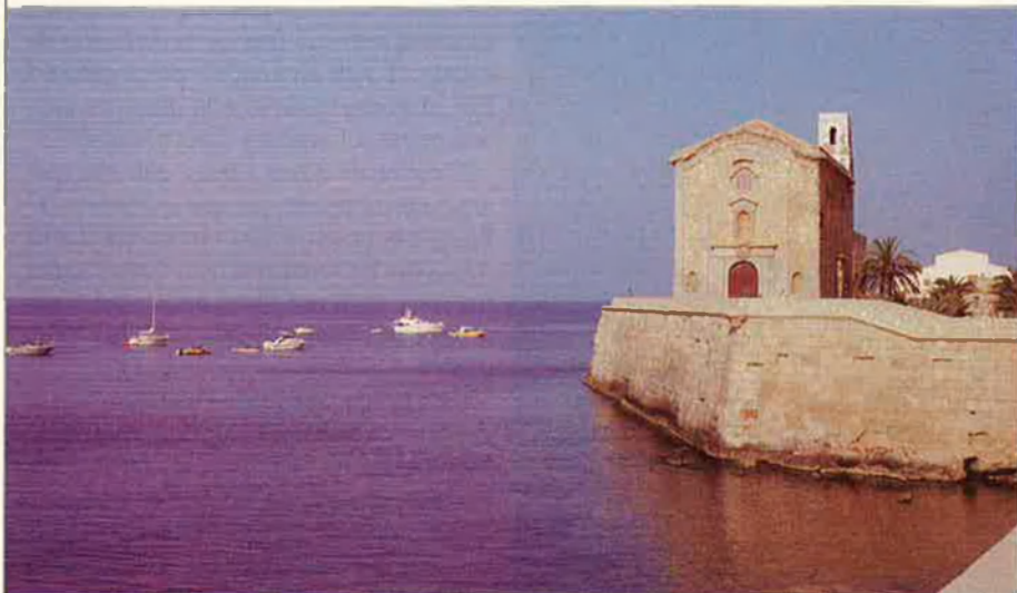
“Peníscola: sempre val la pena passejar per aquesta península tan ben posada i corpulenta. Perquè hi trobareu un castell amb muralles que han conspirat des que el poder és poder”.