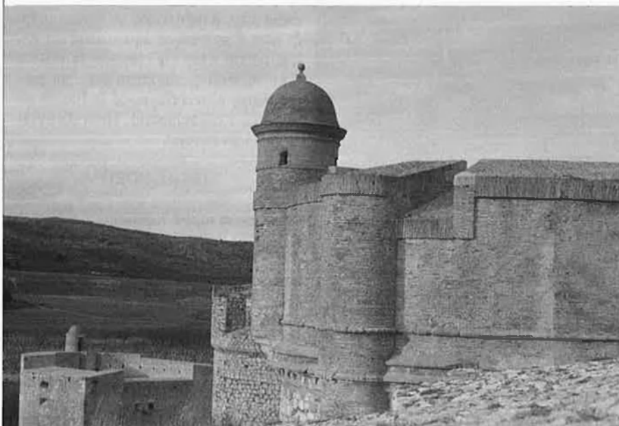
“Com el dia és bo, ens hem obert per enfilars, amb una bordada cap a ponent, el port del Barcarès, per endevinar, darrere, el simpàtic castell de Salses”.