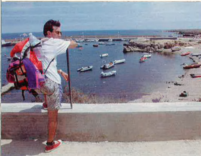
"...veure Tabarca, illa que voldríem trepitjar, ni que fóra per un dia, per experimentar la duresa del territori curt i dur".