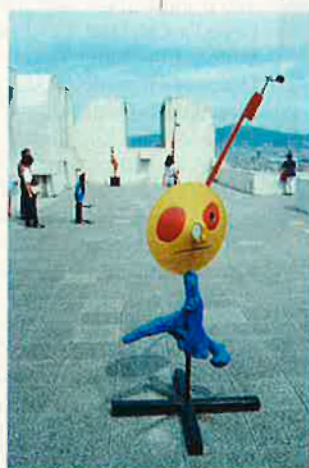
A la Fundació s'hi han pogut veure obres inèdites de Miró junt amb les permanents de sempre.