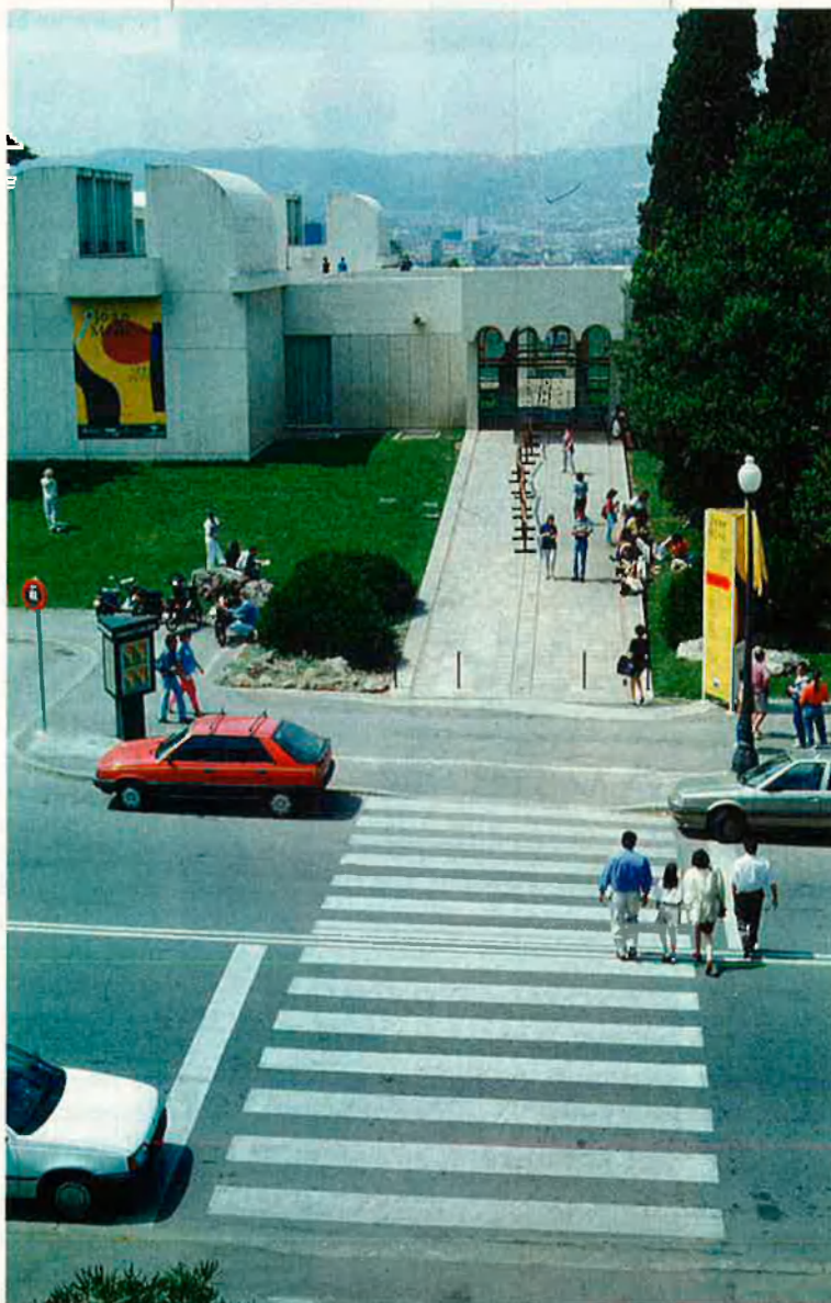
Si bé es preveien uns 300.000 visitants, l'assistència final no ha arribat als 250.000.

La preparació de l'antològica també havia portat cua: quatre anys abans s'establien els primers contactes amb el director del Museu d'Art Modern de Nova York (MOMA), Richard Oldenburg, i amb diversos col·leccionistes, museus i galeries de tot el món. L'objectiu: aconseguir de reunir les peces més significatives de l'ar-