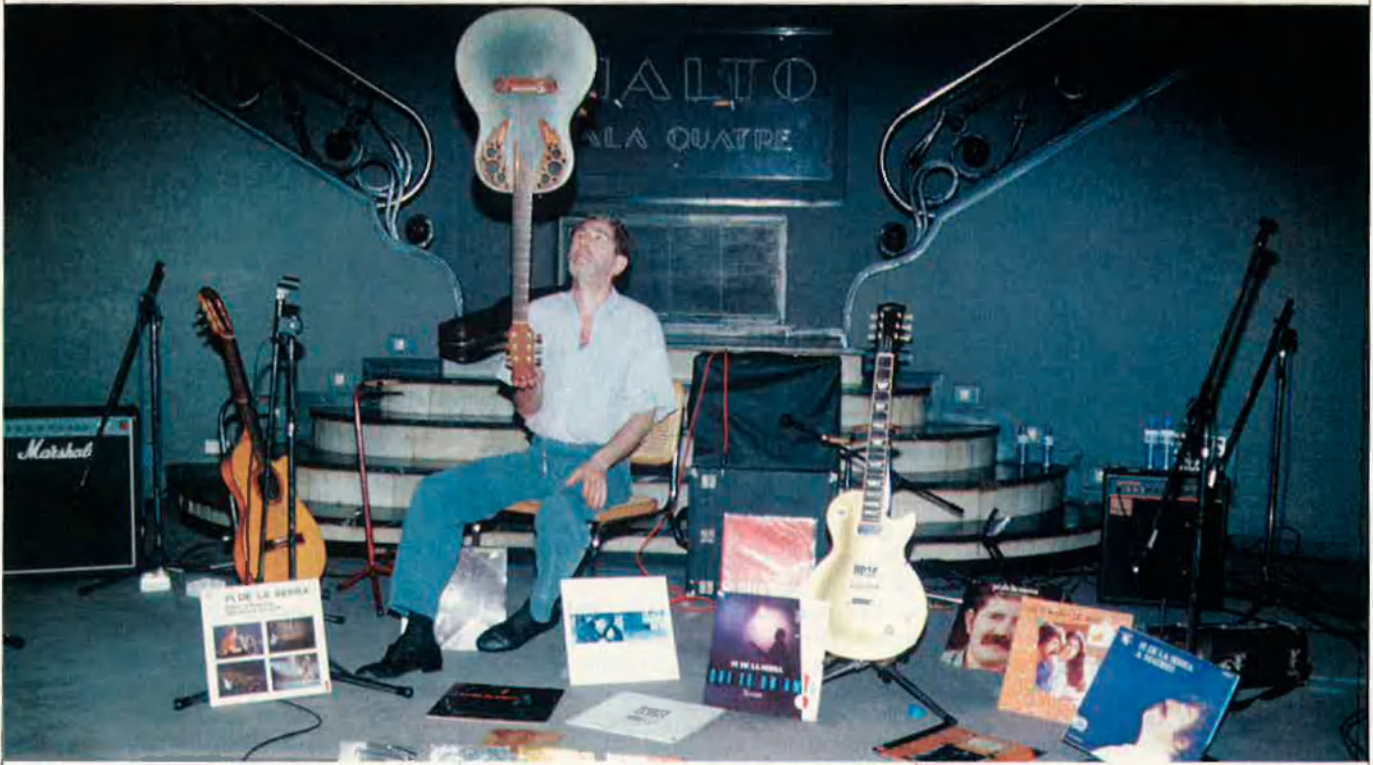
"Això és un ofici i jo m'ho agafo com una feina. Crec que he tingut molta sort de fer el que faig, però m'agradaria viure sense treballar."