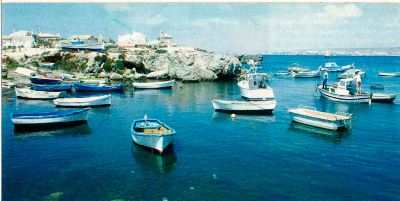
L'Ajuntament d'Alacant vol dinamitzar l'activitat turística de l'illa fins a mantenir-la durant tot l'any.