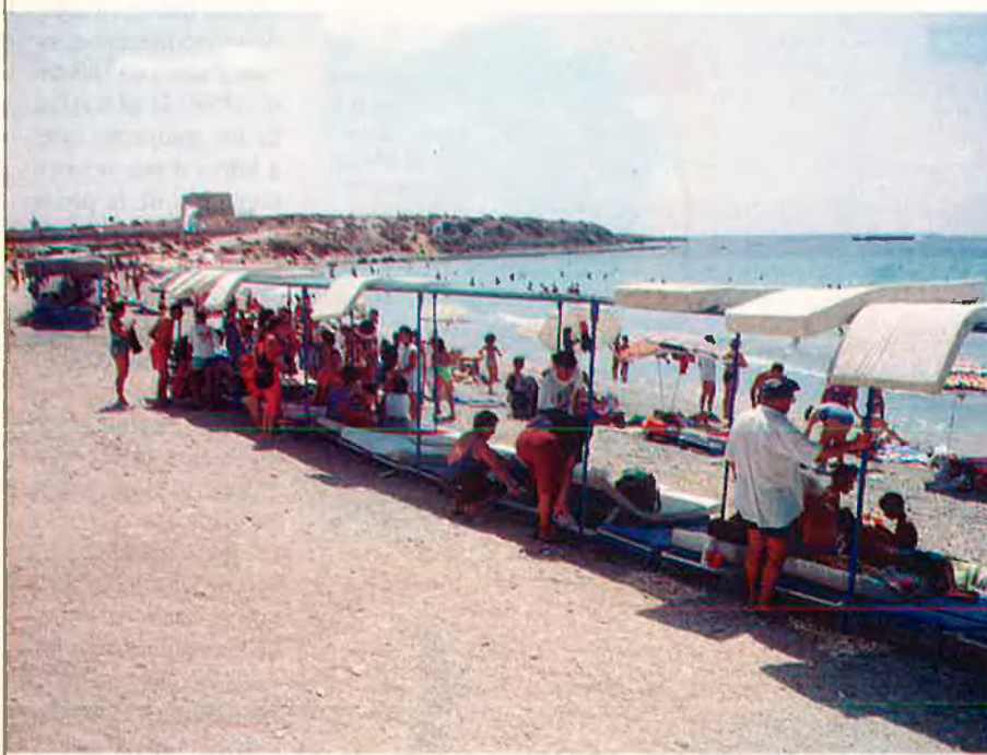
El projecte preveu el trasllat de les guinguetes de platja per deixar pas a un passeig marítim. RAFA GIL