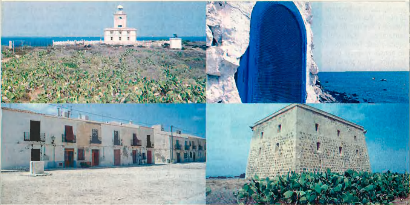
L'illa està habitada per unes 200 persones a l'hivern, xifra que es duplica a l'estiu per poder fer front a la demanda de serveis dels milers de visitants que arriben cada dia des d'Alacant, Santa Pola o Torrevella.