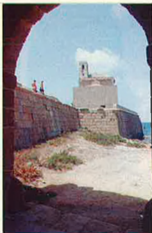
El recinte fortificat de Tabarca és del segle XVIII. RAFA GIL

El projecte, que té un pressupost de més de 70 milions de pessetes, preveu, segons es pot veure en el plànol adjunt, crear una nova zona de serveis entre la platja i el port on anirien tres restaurants, una oficina de correus, una botiga de fotografia, telèfons públics, lavabos i un monument per homenatjar el sol i el vent. Al costat de la central solar aniran a parar cinc guinguetes més i les altres tres se situaran en la plaça que hi ha al costat de l'entrada al nucli urbà. La creació d'un Museu d'Arts de Pesca i d'un aquari amb espècies autòctones són altres atractius que s'afegiran als naturals encants de l'illa.