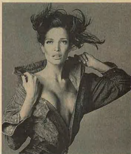
Stephanie Seymour era fins fa poc la companya d'Axl Rose, cantant dels Guns n'Roses.

Rachel Williams: Va néixer a Nova York el 19 d'abril de 1967. Viu a Los Angeles. Es queixa que a causa de la seva talla (medeix 1,83), els estilistes europeus la contracten poc. 91 de pit; 63 de cintura i 91 de malucs. Es soltera i diu que, a part de guanyar diners, aquesta professió no serveix per a res, com a màxim per veure món. Li agrada que li facin fotografies agosarades. En aquesta, vestida amb làtex brillant, es pot comprovar que la seva alça-