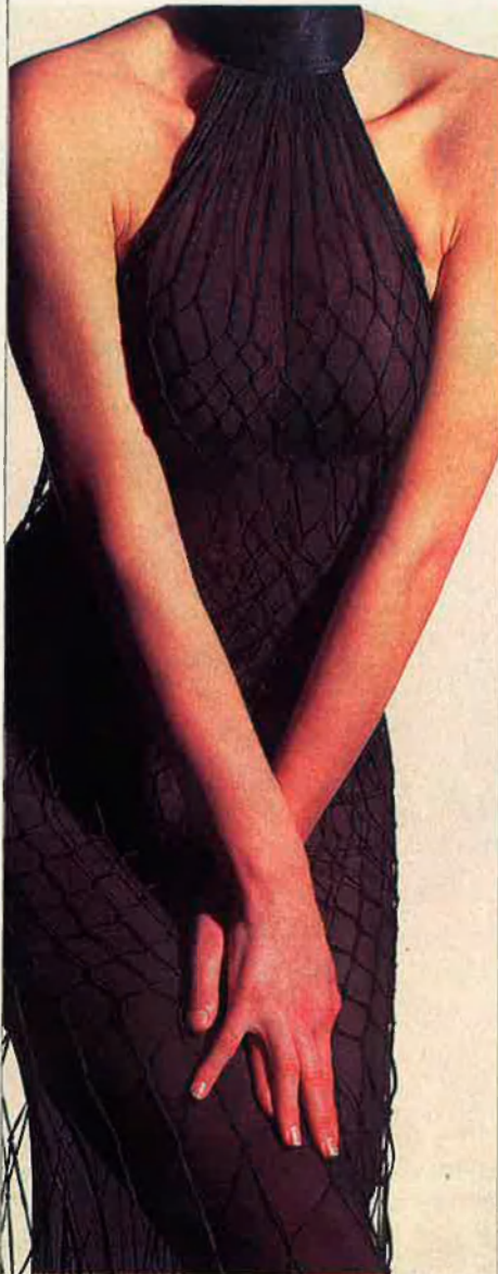
A Eva Herzigova li deien que era "guapeta", però que no n'hi havia per tant.

Kate Moss: Algú ha dit que Twiggy va ser als seixanta el que Kate Moss serà al final d'aquesta dècada: ossos. El seu aspecte és més el d'un adolescent androgin que no