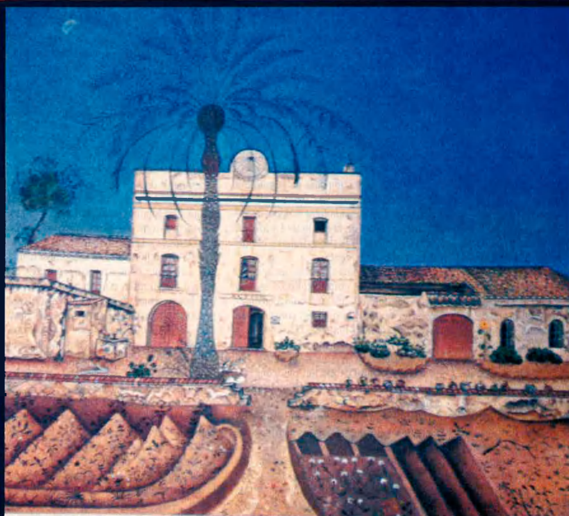
La casa de la palmera, un mas que continúa habitat.