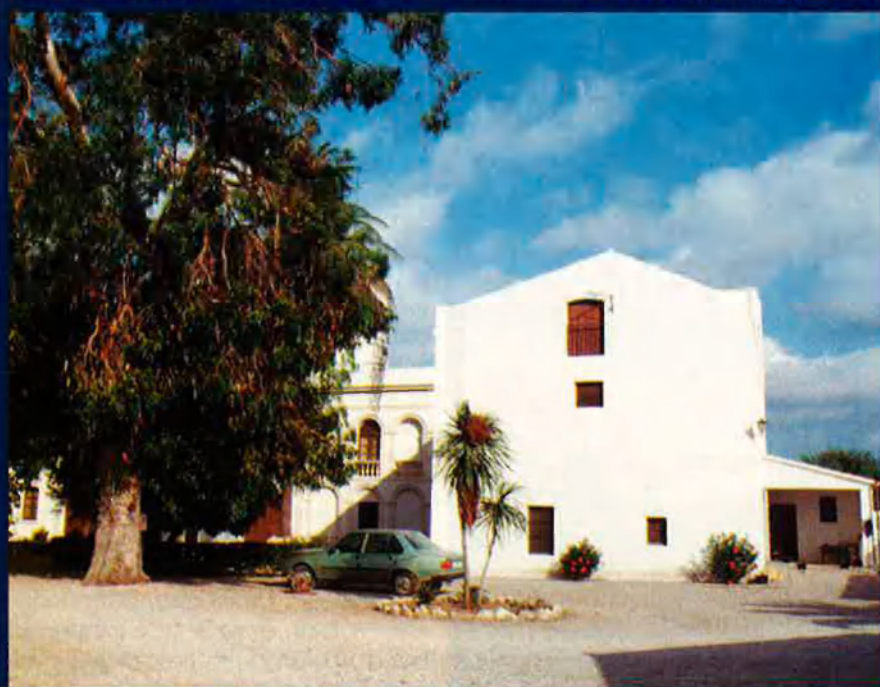
La masia, avui emblanquinada, pintada i repintada, clenxinada i repassada.