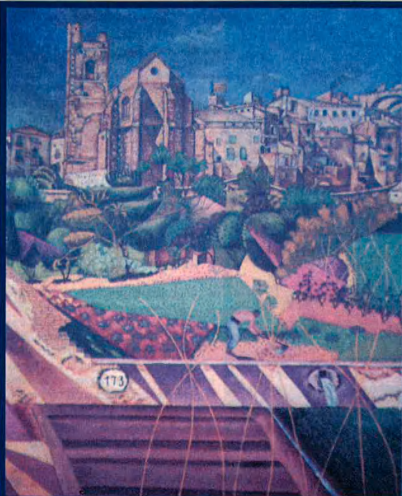
Poble i església de Mont-roig, on la vorera s'eixampla, a l'indret més còmode.