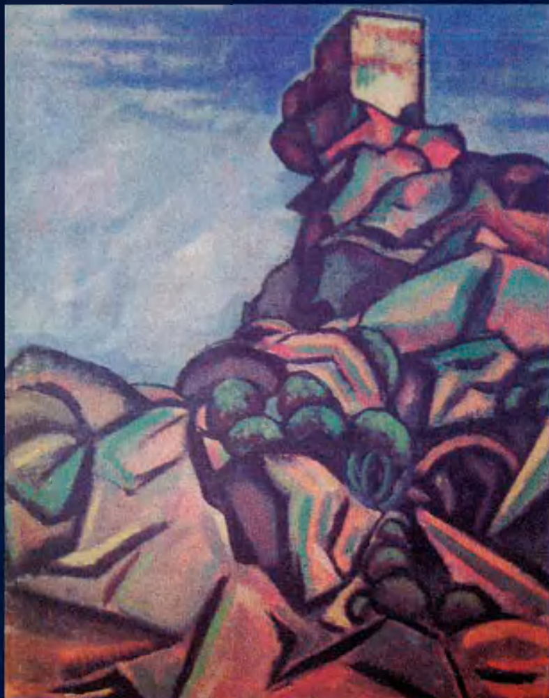
Mont-roig, Sant Ramon, un paisatge popular entre els habitants de la rodalia.