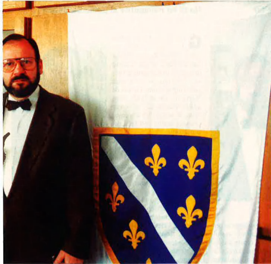
gut dominar els musulmans quan són com ells.”