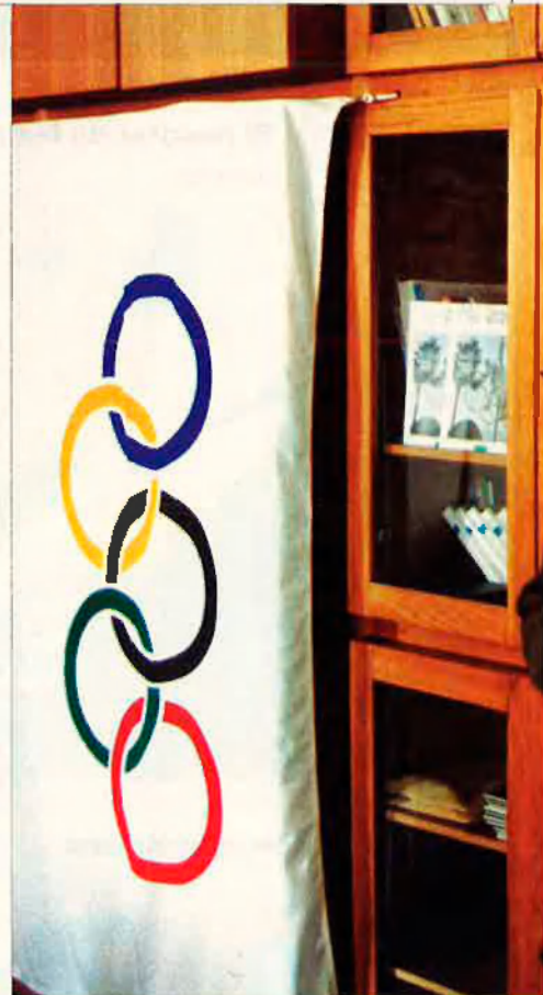
"L'error dels croats a Hercegovina és que han vol-

—Havia de fer-ho però va demostrar que no ho volia. Aquest ha estat el seu error polític més imperdonable. M'havia de do-