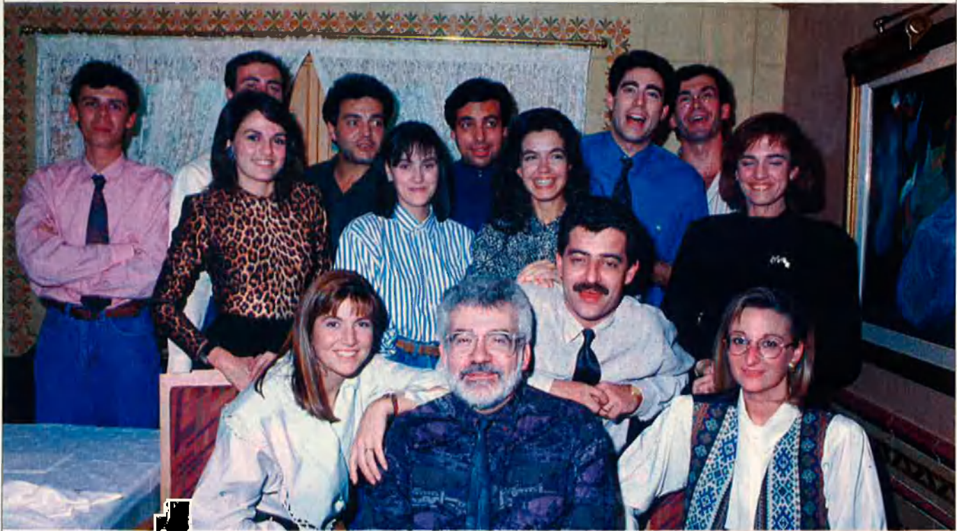
Les cares de TV3 podrien veure's a tot Europa aviat.