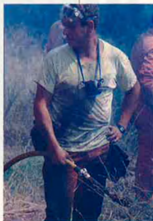
Lluitar contra el foc és una baralla contínua.