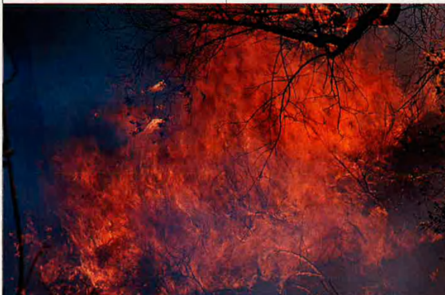
Els desastres causats pels incendis semblen inacabables al nostre país.

Però l'espectador excepcional dels fets en tota la seua magnitud fou Xemi Baviera, propietari del restaurant Venta de l'home. Des de l'establiment, es divisa un panorama grinyolant: la carretera Nacional III travessa les muntanyes pelades pel foc. Al costat, manobres de la construcció provoquen demolicions amb explosius per construir una autovia que unirà València amb Bunyol i Venta Mina. El verd llunyà, els vessants arrasats, els clàxons dels vehicles, els embussos de trànsit i les obres a mig fer, ajuden al surrealisme: "el dia del foc vaig veure com molts brigadistes d'auxili s'amagaven espantats. Tècnics forestals que desconeixien el terreny, donaven instruccions errònies. Hi va haver una gran descompensació, i la flama va morir perquè l'autoritat municipal, en