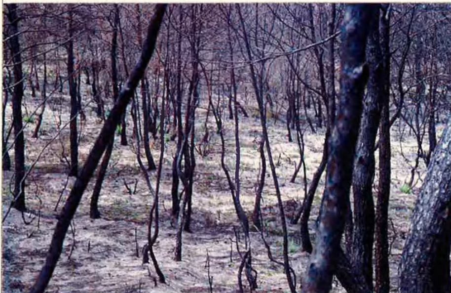
Els boscos, després de les flames, queden com cadàvers de fusta.