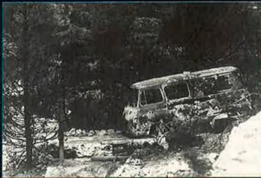
Gran quantitat de bens ecològics i materials han estat assolats pel foc.