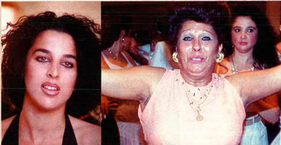
L'ètnia gitana té presents els seus orígens.