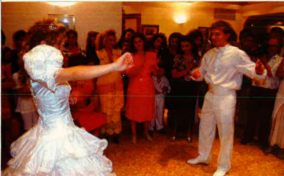
Hi ha poques coses tan coloristes i apassionades com un casament gitano.