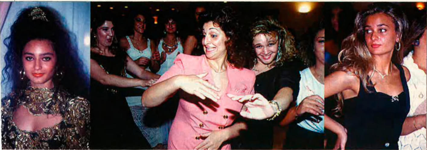
Les dones ja han iniciat un camí de transformació.