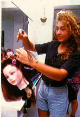
L'Associació de Dones ensenya oficis a les joves. RAFA GIL

Si saltem a Palma, trobem que el gitano mallorquí pateix les sempiternes tribula-