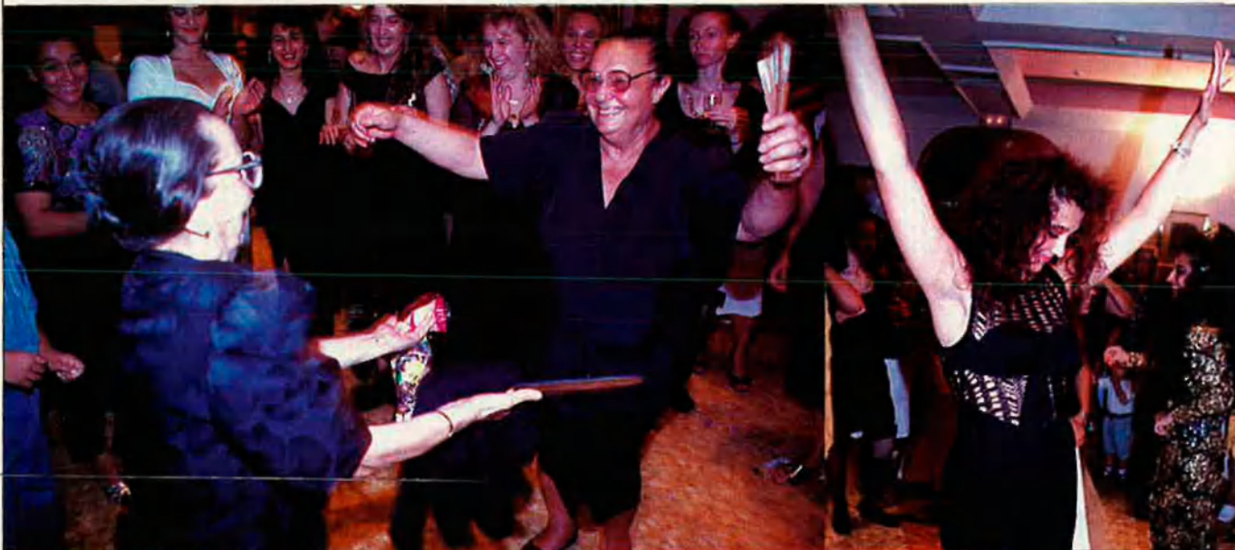
Perseguits per tot Europa, el seu exotisme no és acceptat fàcilment.