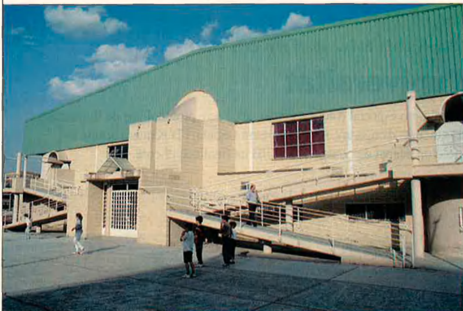
El planter del Bàsquet Llíria ha nodrit els millors equips de l'estat espanyol i té ara dos mil xiquets.