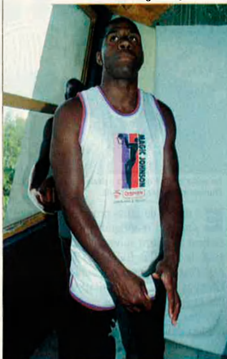
El Llíria tenia contactes amb Magic per a celebrar els seus 50 anys.