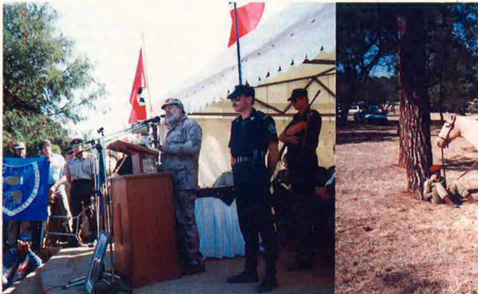
Eugene Terreblanche (esquerra) és el líder de l'AWB, organització paramilitar d'ultradreta que reclama la

Els boers, descendents de colons holandesos, es van establir a la Ciutat del Cap al segle XVII. Quan els anglesos es van apoderar de la colònia, bona part d'ells van aplegar bous i carros, i van emprendre el Gran Trek cap al nord. No estaven disposats a consentir la dominació cultural britànica ni la política liberal que, en-