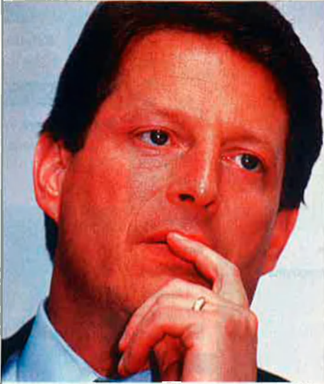
L'equip del vice-president Gore va treballar en la redacció de l'informe.