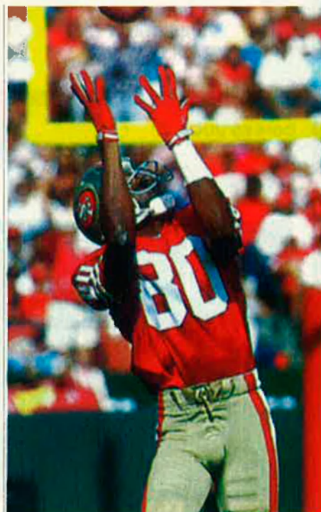
Jerry Rice, les mans d'or de la NFL (San Francisco).

49ers i Steelers són dos dels guanyadors de la SuperBowl, gran trofeu del futbol americà que l'any passat era el XXVII.