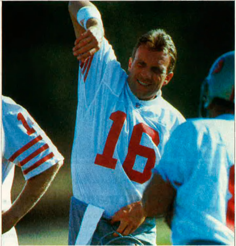
Joe Montana serà el gran absent.