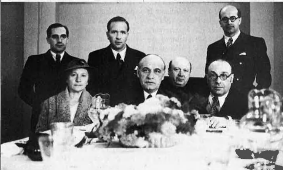
Drets: Xabier Zubiri, L. Recasens Siches i José Gaos. Asseguts: Maria de Maeztu, José Ortega y Gasset, un sacerdot i García Morente.