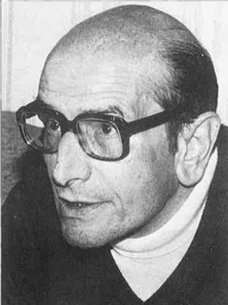
Vicente Gaos va guanyar diversos premis de poesia.