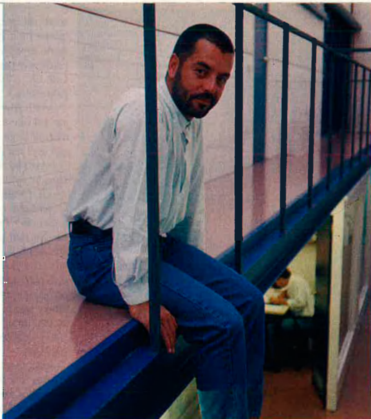
“A València encara es troba una disponibilitat grandiosa, molta passió i un punt de follia a l'hora de fer teatre.”

—Just abans que a València es fes el Centre Dramàtic existia una mena de teatre públic que funcionava a la sala del Principal, un dels teatres més macos d'aquest país, que dirigia Díaz Zamora. Flor de otoño volia ser una carta de presentació d'un nou tipus de teatre a València. En anar-lo a muntar es van trobar que tenien molts actors de repartiment, però