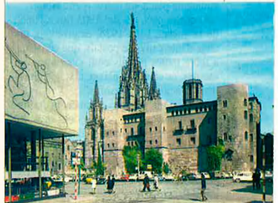
La postal és el tercer objecte més col·leccionat del món.