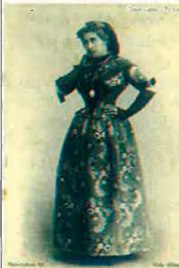
Carta Postal en Tercer Milenio del 1924.