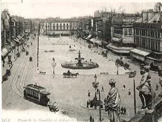
MGX. Plaça de la Concordia al Alt de Viena.

La mida d'aquesta primera postal era de 12x8,5 cm, unes dimensions més reduïdes que no les oficials adoptades més tard per la Unió Postal Universal. La targeta fou impresa en negre sobre fons crema, i portava gravat un segell, que costava la meitat del franqueig d'una carta corrent. L'efigie de l'emperador