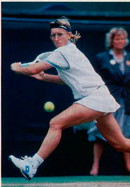
Martina Navratilova fa temps que lluita per allargar la seva carrera professional.