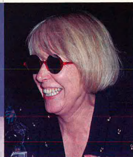
Josep M. Mainat i Rosa M. Sardà és una altra parella de famosos que viuen sense ser matrimoni.