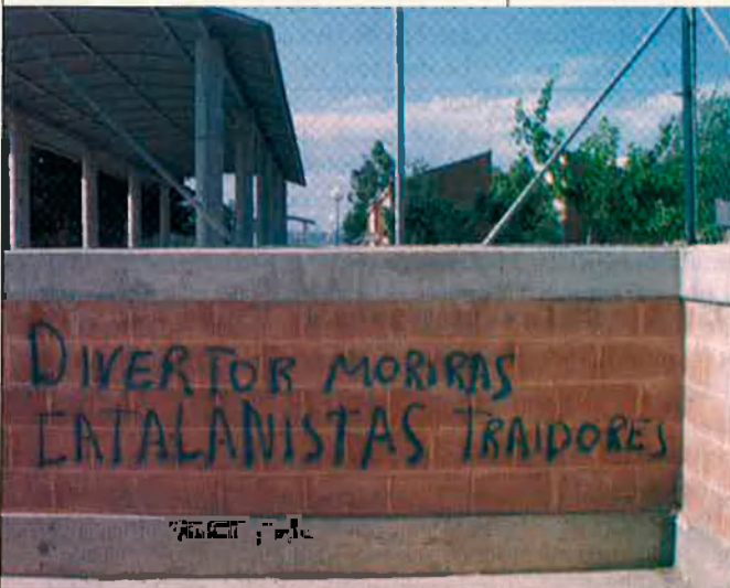
Les pintades amenaçadores no han aconseguit parar la normalització lingüística al col·legi Cervantes de la Pobla de Farnals (l'Horta).