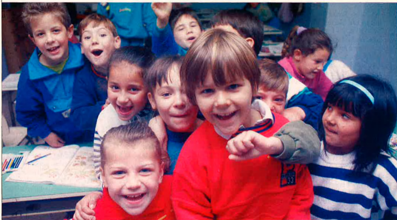
Malgrat l'espectacular augment, el nombre de xiquets escolaritzats en català al País Valencià encara és molt petit.

Per al proper curs hi ha previstes al País Valencià més places d'ensenyament primari i secundari en català que mai. L'augment és evident, tot i que alguns grups de mestres reticents a aprendre i utilitzar el català han creat una polèmica falsa a la qual ha donat suport el Partit Popular.