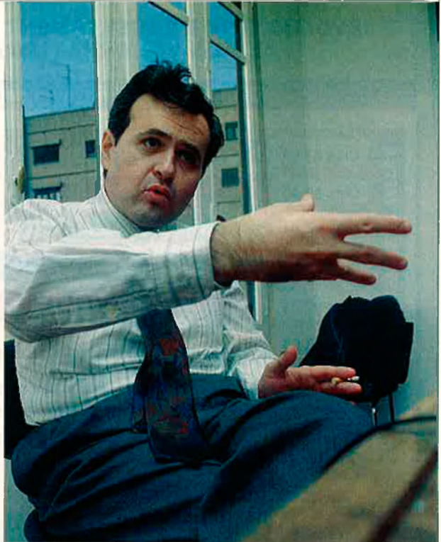
J. Calomar de portaveu dels mestres que no volen aprendre català.

L'augment de la demanda de cursos en català ha obligat els responsables educatius a convocar la gran majoria de les noves places "en valencià" i a modificar moltes de les ja existents, que perden la qualificació d'"en castellà" per passar a "en valencià". Si el mestre que tenia una plaça en castellà està