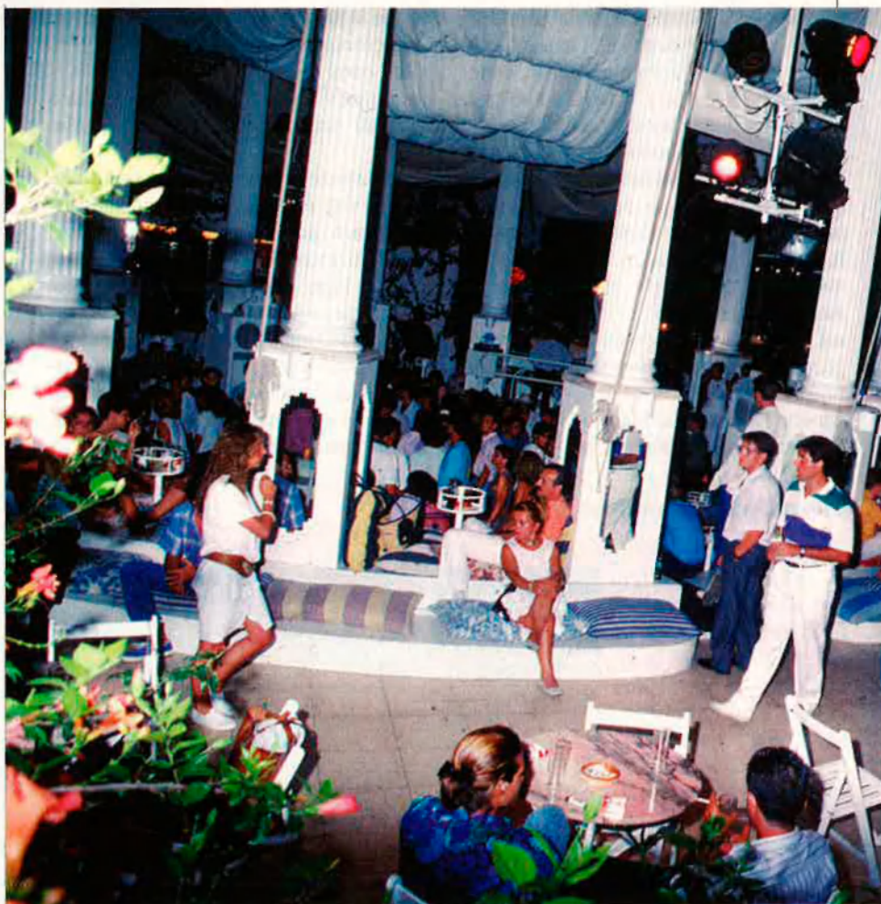
“La idea de Eivissa com a zona de permissivitat i promiscuïtat és molt estesa, però l'illa no és només això”, del Foment del Turisme.