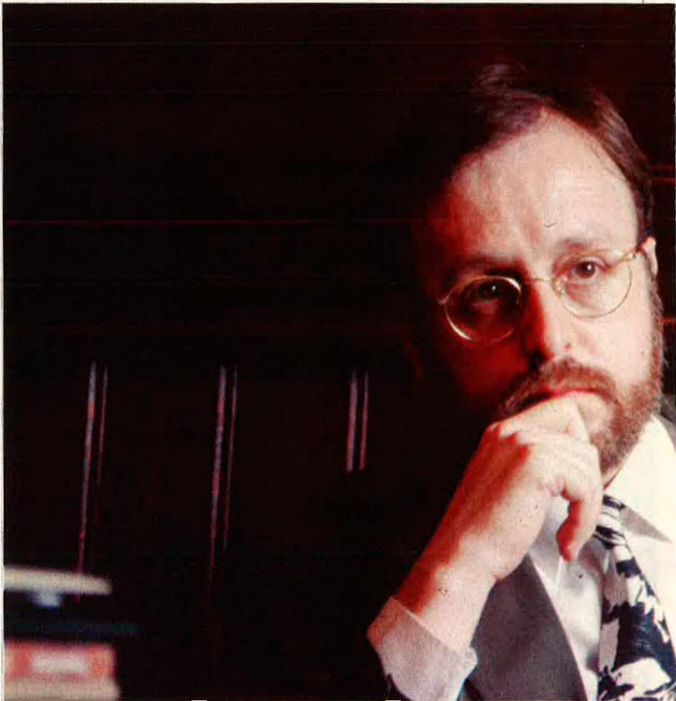
"L'actuació del president Pujol és feta en clau nacional i per tant és correcta".

—És clar. Són mesures que veus venir. A Alemanya, li costa pair la unificació. Segurament encara retallarà més, com ara la seva participació en els fons de cohesió europea. La crisi és per a tothom i els es-