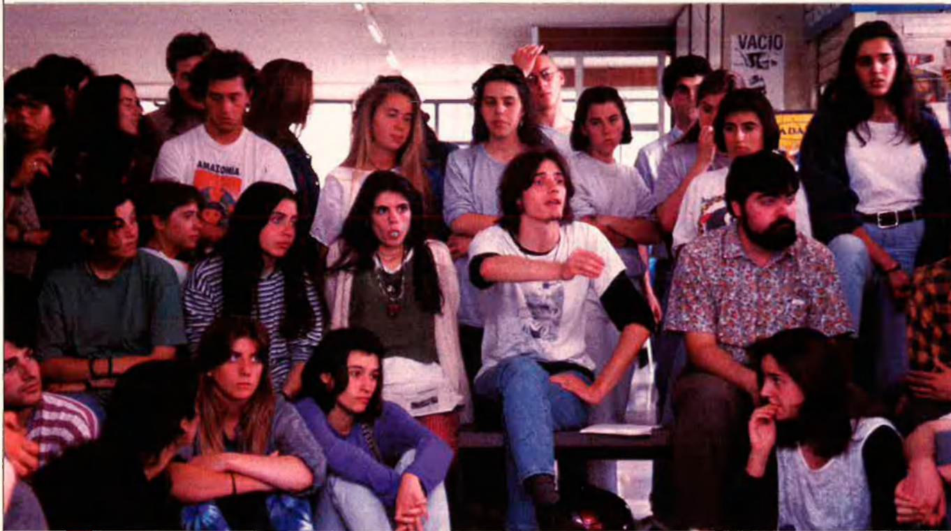
Els universitaris hauran de ser molt més competitius a partir d'ara.