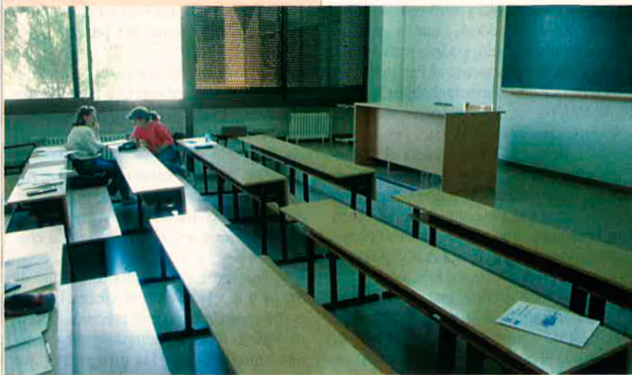
La Jaume I de Castelló, una universitat pilot per a la transformació.