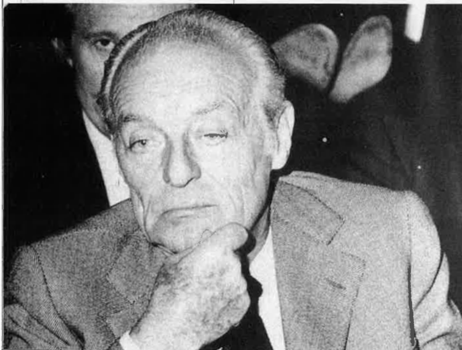
El baró Guy de Rothschild, en 1975.

A Llatinoamèrica, els Rothschild entren per la porta gran: Brasil. Leopold Rothschild va anar-hi amb vaixell. A punt d'arribar a Rio de Janeiro, un dels acompanyants