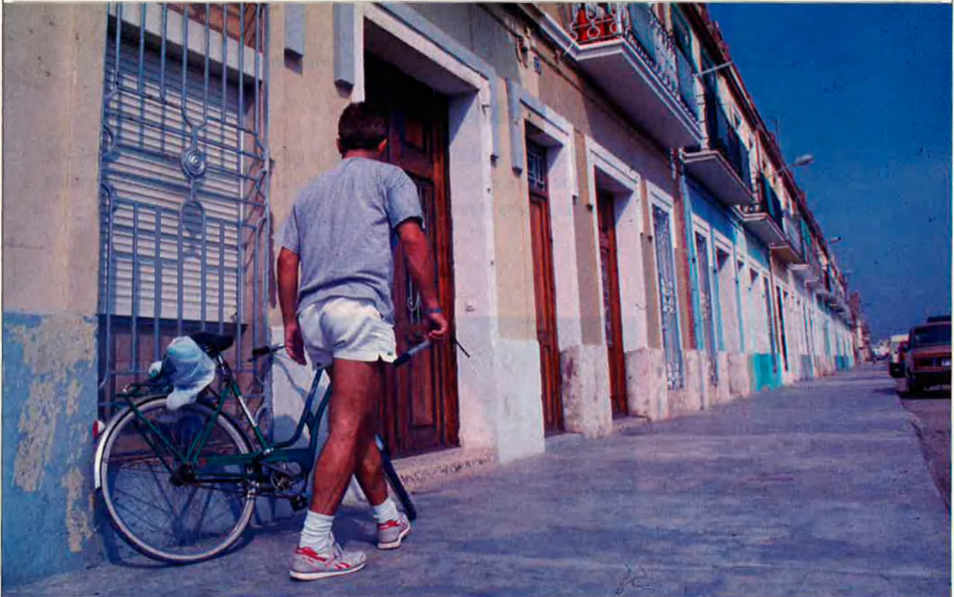
L'Ajuntament de València recorrerà la declaració del barri del Cabanyal com a zona d'interès històric contra el Consell, esperonat per altres èxits anteriors.