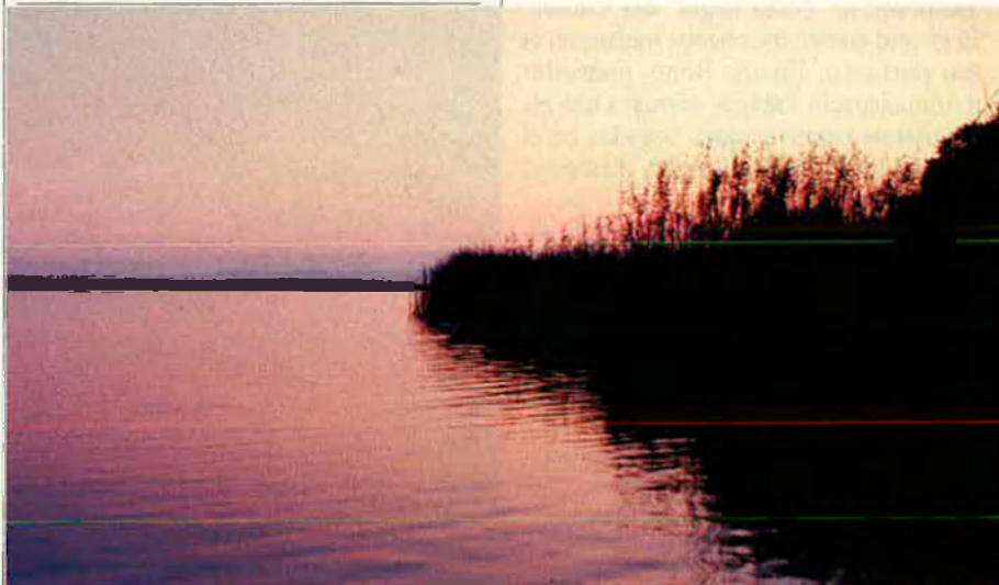
En la declaració de parc natural de l'Albufera, no es va consultar el Consell d'estat.

La sala de contencions fou també la que donà la raó al grup ultradretà d'estudiants, (AU), disgustats que la Universitat de