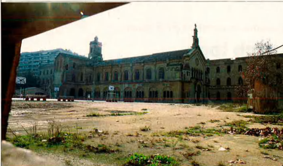
El solar dels Jesuïtes, un cas perdut per la Generalitat valenciana que va oblidar presentar un informe sobre la necessitat de sòl escolar.