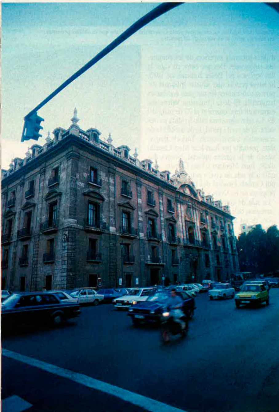
Les sales del TSJCV s'han convertit en camp de batalla per al Consell de la Generalitat i l'oposició.