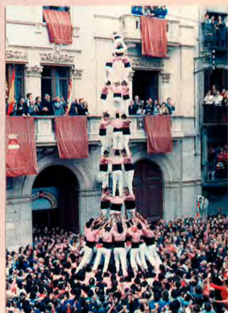
Els castells de nou pisos són, des de fa deu anys, el principal motiu de l'actual esclat d'activitat i afició castelleres.

De la resta de colles la majoria es mouen en els castells de set (Alcover, Castelldefels, Cornellà, Gelida, Ganxets de Reus, Santa Coloma, Sant Pere i Sant Pau, Serrallo, Vila-seca). De totes maneres, destaquen els Castellers de Barcelona, els Xiquets de Reus i els Castellers de Terrassa que han assolit més d'un cop el quatre de vuit . Altres colles, han carregat aquest castell (Bordegassos) o han aixecat en altres moments castells importants, com la torre de set (Minyons de l'Arboç) o el pilar de sis (Nois de la Torre i Xicots de Vilafranca). Cita a part mereixen els Nens del Vendrell, que avui aixequen només castells de set, però que als anys 60 i 70 foren uns dels principals responsables del