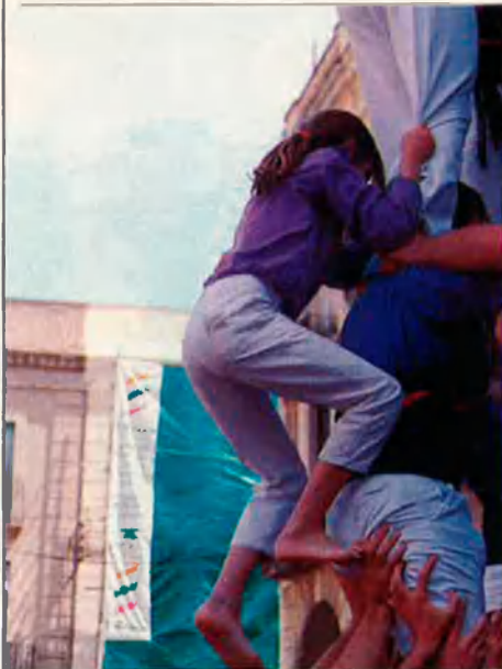
Una castellera pujant "finet i pel mig".

Per ordre alfabètic, amb la data de fundació i el color de la camisa: