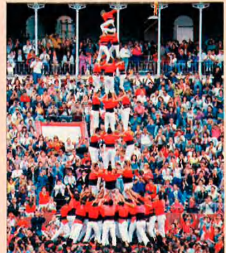
Concurs de Tarragona 1992. Va ser la diada més important de la història, però va superar-se abans d'un mes.

-Diada Nacional a Valls i altres viles (10 i 11 de setembre)