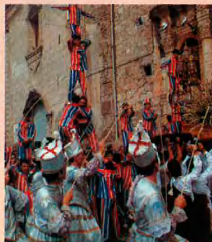
Moixeranga d'Algemesí, un dels possibles orígens dels castells actuals.

L a persona que fa castells i tot allò que es relaciona amb l'activitat de construir castells humans a partir d'unes tècniques i uns costums que han esdevingut comuns o semblants en tots els col·lectius que s'hi dediquen.