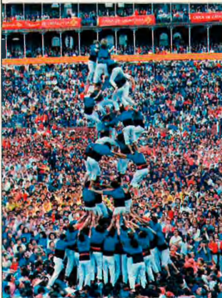
Llenya d'un quatre de nou amb folre. A la dreta, Cinc de vuit, vuit pisos de cinc castellers a cada pis. Li diuen la catedral dels castells.