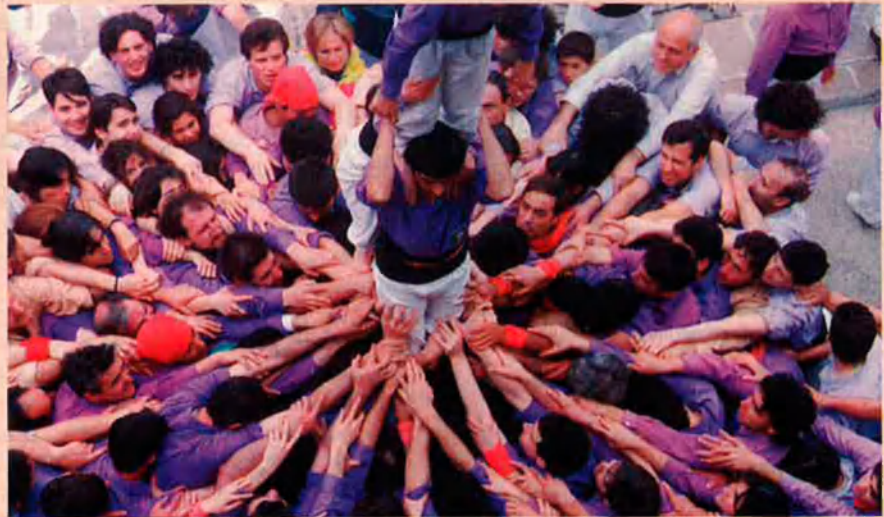
Mans a la pinya d'un pilar.

Inicialment, el color més característic de les camises castelleres era el vermell, en diverses variants; ara hi ha colors per a tots els gustos, proliferen els morats i també els blaus, hi ha de verds i de grocs, marronosos i grisos; els més originals són els Xiquets de Tarragona que, fruit del seu origen (la unió de dues colles locals) porten camisa de ratlles.