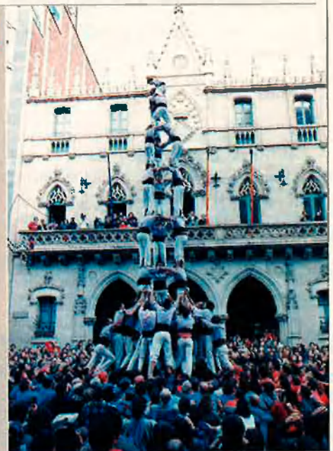
Tres de nou amb fira. Tres per pis, nou pisos i doble pinya

set pisos), tres de vuit (tres castellers per planta i vuit pisos), quatre de nou (quatre persones per nou nivells), cinc de sis (cinc de base i sis d'alçada); la lògica del nom ve del seu origen, quan els castells