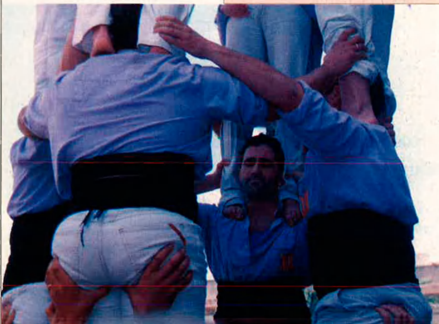
Els segons, ben reforçats pels pruneres mans. Força i equilibri, dues constants dels castells