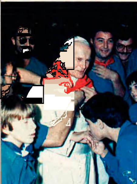
Una visita recent a Joan Pau II. Els castellers són ja un símbol de Catalunya.