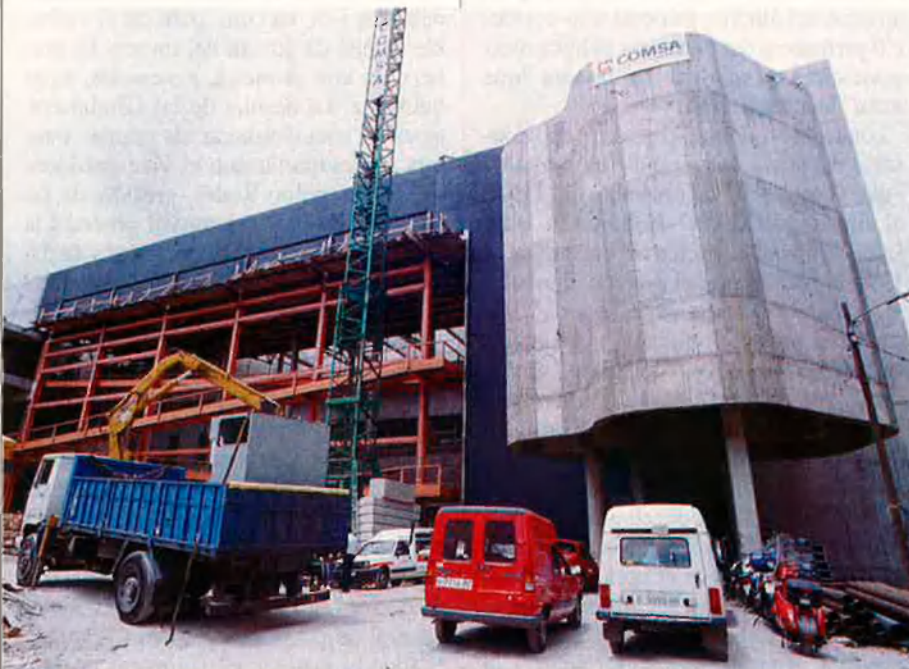
La tardor de 1994 s'inaugura, al centre històric de Barcelona, un fantàstic submarí blanc.

Però l'empat va desfer totes les previsions. La conferència de premsa de la Fundació, del 9 de novembre, presentant unilateralment el projecte Froment, va cremar per sempre les possibilitats del museòleg francès a Barcelona que, mesos després, reclòs al balneari de Bordeus, molest i confús, es considera "utilitzat" per Subirós. La conferència de premsa institucional, l'endemà, va sedimentar públicament l'estratègia Bohigas-Guitart i, de retruc, va consolidar l'aliança interna Bohigas-Vicens a la regidoria de Cultura que té, en clau política, un significat d'entesa bàsica entre els dos socis de l'ajuntament, PSC i IC. La carta posterior dels seixanta-un empresaris a l'alcalde denunciant l'actitud "insultant" de Bohigas va provocar, en pocs dies de diferència, una carta de suport a l'arquitecte per part de seixanta-un intel·lectuals. Una braça massa igualada on Subirós tan sols es defensa