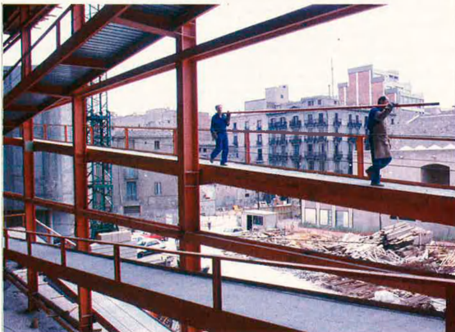
Les obres de la segona fase del MACB, encarregades a l'empresa COMSA, van a ple rendiment.

Al novembre de 1992, Pep Subirós i Oriol Bohigas, forçant mútuament les bones maneres, podien sopar amb Pasqual Maragall i fer-li creure que no hi havia res d'insoluble al MACB. A la sobretaula, podien imaginar-se que les seves diferèn-