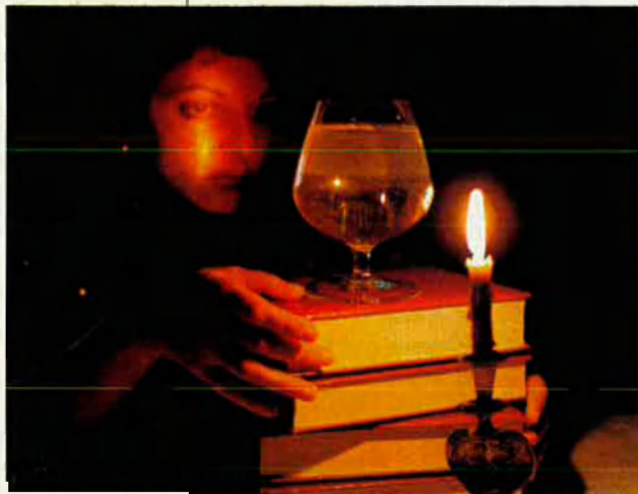
Als anys 90 la màgia i l'espiritisme no para de rebre nous adeptes.