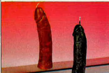
Fal·lus màgics amb suposades qualitats paranormals.