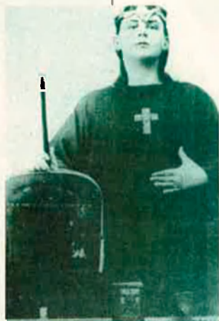
Aleister Crowley era el major ocultista del seu temps.