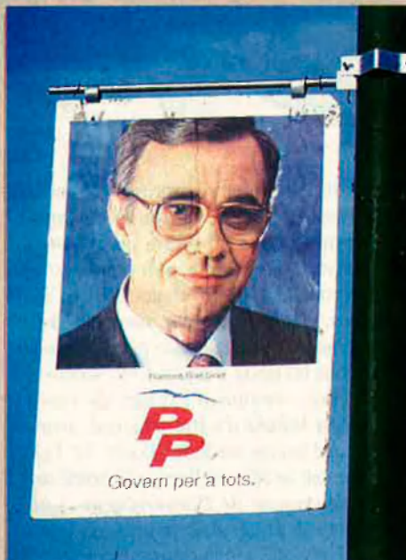
El triomf del PP no va tenir la contundència que alguns esperaven.