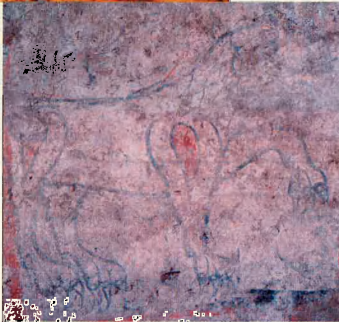
Dos murals romànics han estat descoberts durant les excavacions arqueològiques.