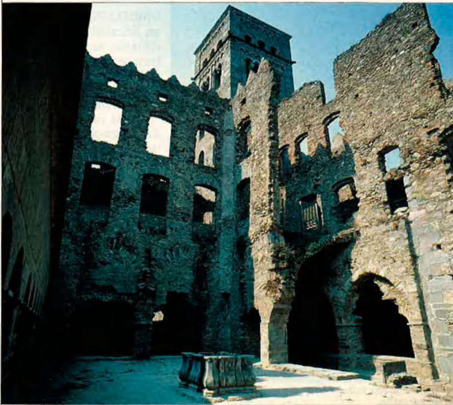
Angle nord-oest del claustre amb els únics vestigis originals del porxo del claustre dels segles XII i XIII.