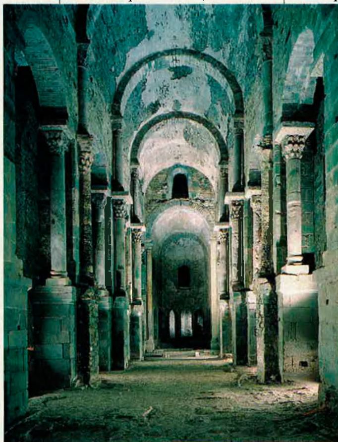
Interior de la nau central vers llevant.

des, juntament amb les guerres contra França i les espoliacions. Sant Pere de Rodes, situat en zona de frontera, va sofrir de manera directa les guerres successives pel domini territorial que mantenien les corones de Felip IV de Castella i Lluís XIV de França. Les tropes franceses van saquejar diverses vegades el monestir. Tal era la situació d'instabilitat i d'indifensió que, en aquells anys de mitjan segle XVII, els monjos benedictins abandonaren el cenobi durant sis anys. En una d'aquestes ràtzies, al 1708 i en