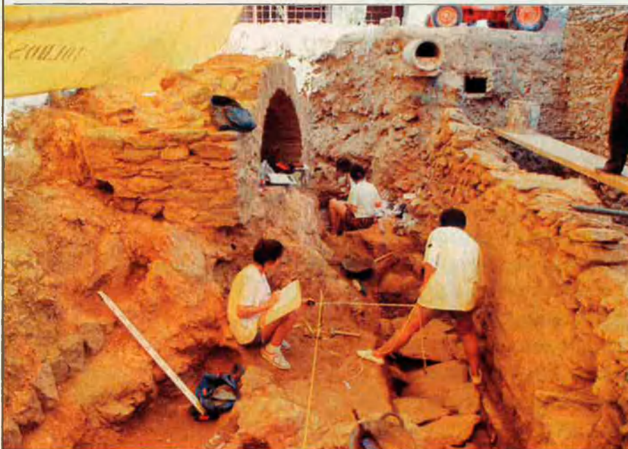
L'estudi arqueològic del monestir es va iniciar al 1988.