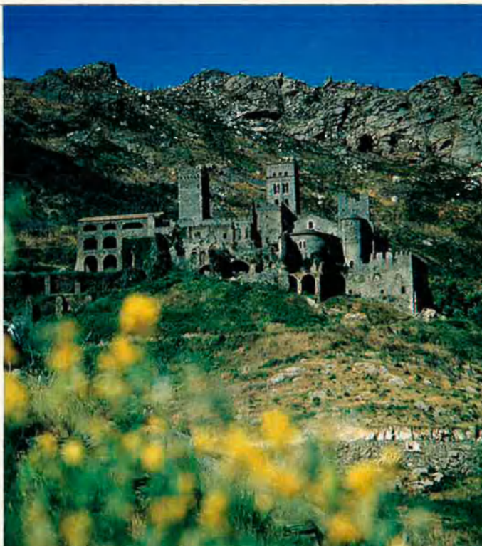
El monestir benedictí de Sant Pere de Rodès és un dels monuments més emblemàtics del romànic català.