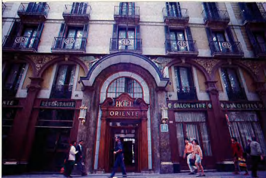
Hans Christian Andersen va passar uns quants dies a l'Hotel Oriente, igual que la muller de George Orwell.