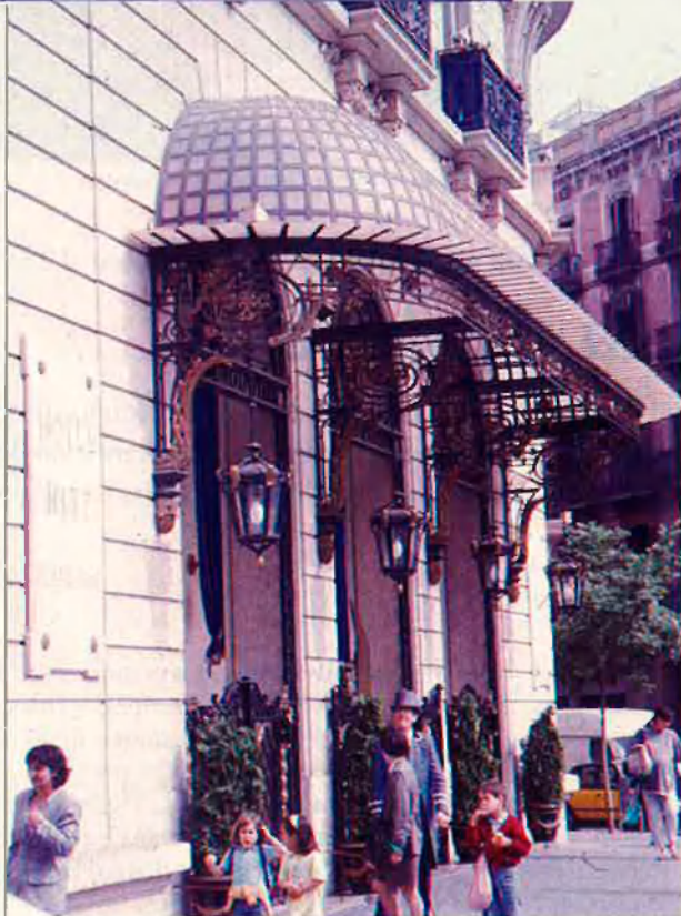
A l'Hotel Ritz, "els radiadors es refredaven amb un soroll de juntures que cruixien", segons Paul Morand.

Hotel Ritz (Gran Via de les Corts Catalanes 668, Barcelona). Paul Morand parla a "La nit catalana" del llibre Obert a la nit d'una Barcelona que "es un clixé sud-americà on els vagons-llits s'obren al