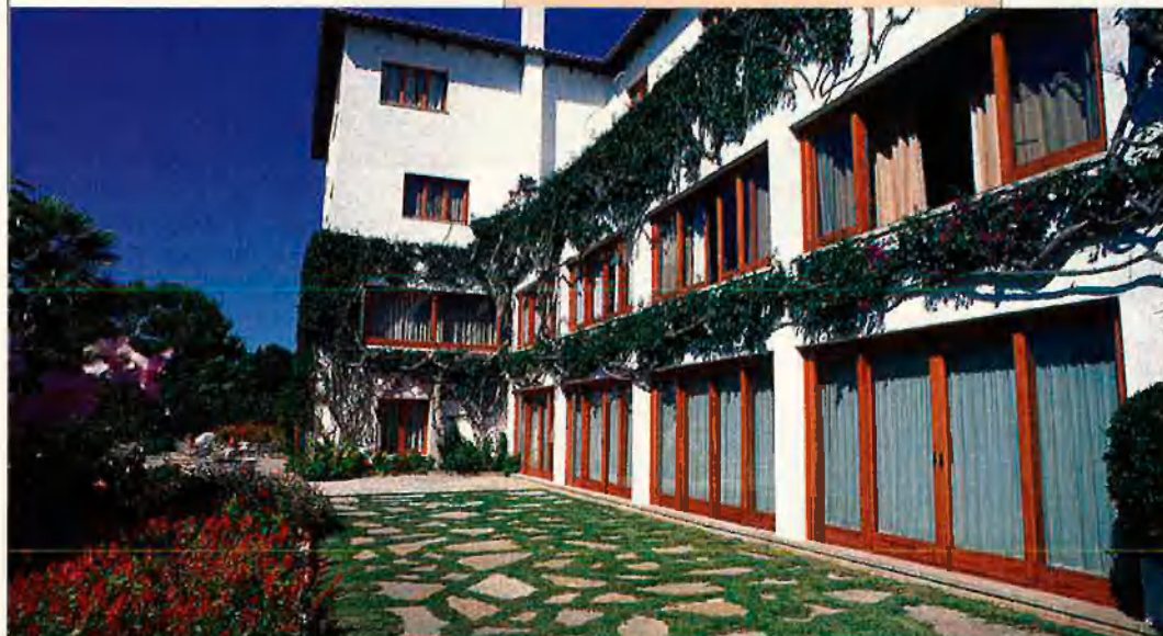
Josep Pla i Eugeni Xammar eren clients habituals de l'Hotel Europa de Granollers (dalt). Damunt d'aquestes línies, l'Hotel Formentor de Mallorca, sempre vinculat a l'art i la cultura.

Hotel París . En la novena secció d'aquest hotel poètic, Vicent Andrés Estellés escriu: "entre el cruixir de llits i el cruixir dels taüts, / l'enrenou de la ploma sobre el paper grossísim, / i l'enrenou dels plats, les culleres, els wàters, / els cadàvers que hi ha desfent-se en la bodega. / Hi ha l'hoste que s'ha mort i no se sap d'on és, / i hi ha l'hoste que espera que li arribi un telegrama, / com hi ha l'hoste que escolta el coit d'un matrimoni / i hi ha l'hoste, cortès que no parla amb ningú".