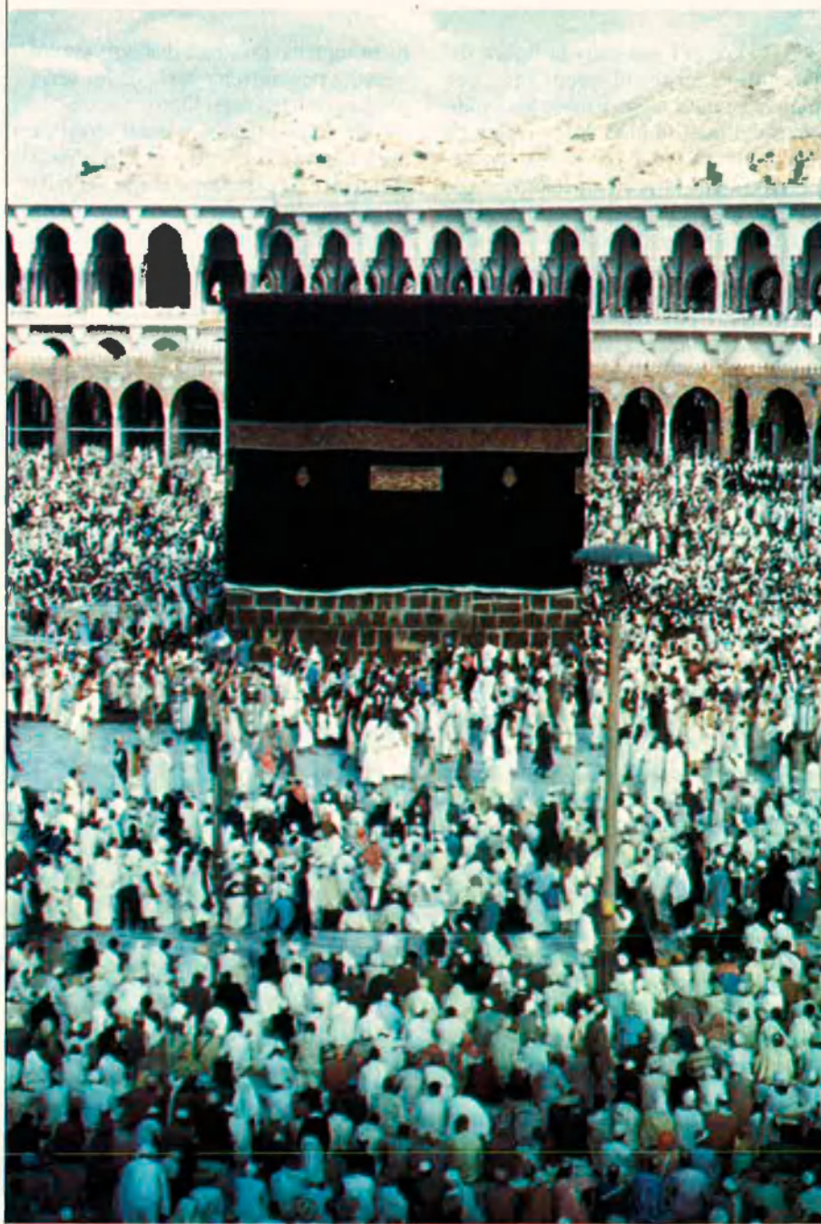
El pelegrinatge a la Meca, amb les voltes a la Kaaba (foto), és el punt culminant de la vida d'un musulmà.

Com cada any, els fidels de l'Islam es preparen aquests dies per al pelegrinatge a la seua ciutat santa, la Meca. La gran festa anual del món musulmà és una bona ocasió per a repassar l'actualitat d'aquest moviment, molt més que religiós.