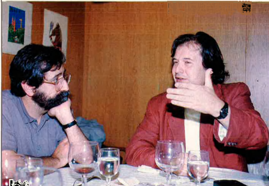
Escenes de retrobament generacional a la taula rodona d'EL TEMPS.