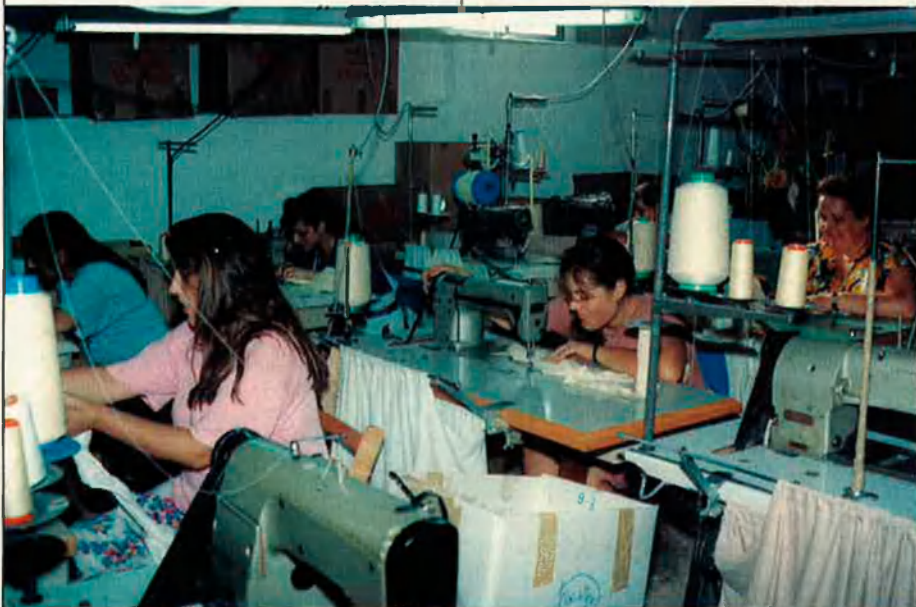
Malgrat els segles d'assentament del tèxtil a l'Alcoià-Comtat, la tecnologia i la competència europea no en permetrà un ressorgiment espectacular.