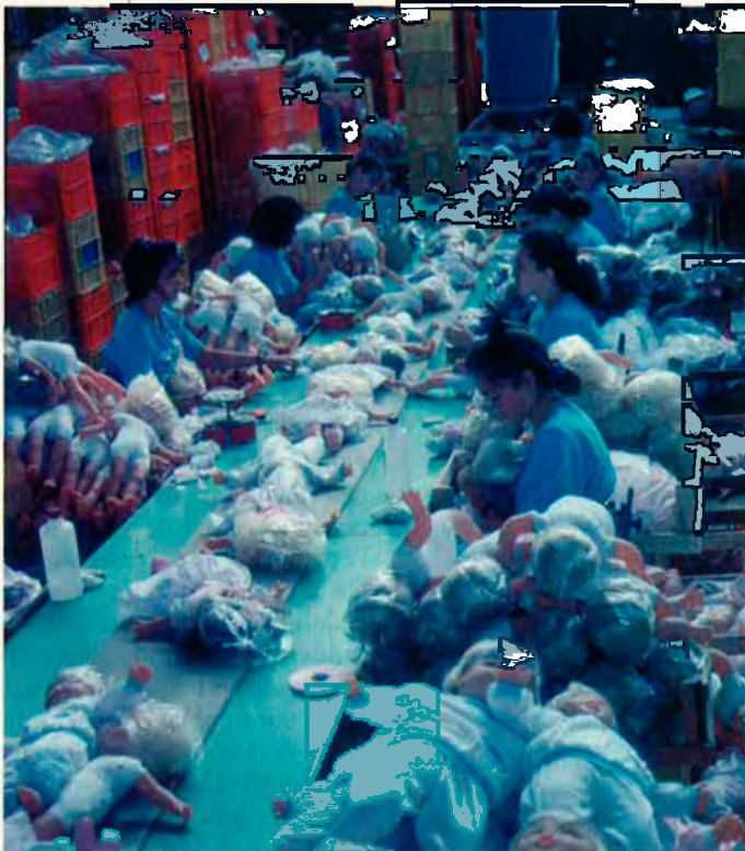
L'any 91 hi hagué el primer resultat negatiu en la balança comercial del sector de les joguines, emplaçat majoritàriament a Ibi i Onil.

1990 s'han reduït a 1.539, i dels quasi 21.000 treballadors que tenia el sector a començament dels 90, en 1992 en quedaven 18.796. Això sense comptar les vint empreses que han tancat durant l'any en curs i els 300 llocs de treball consegüentment perduts.