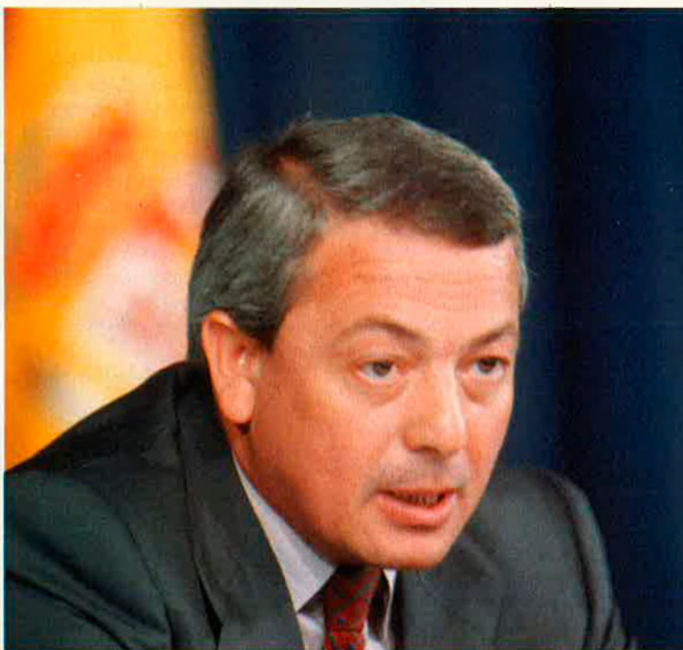
Carlos Solchaga atribueix la devaluació a pressions exteriors.

No hi ha dubte que les pròximes eleccions del 6 de juny i la progressiva pèrdua de credibilitat de l'economia espanyola en general han estat els factors determinants perquè es produïra la tercera devaluació.