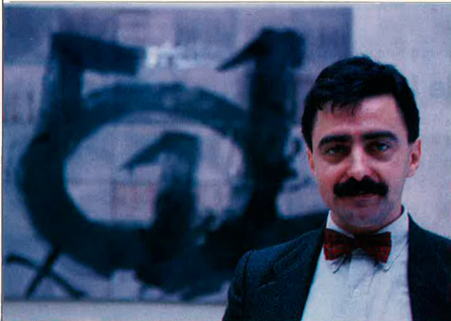
“Quan un artista fa ideologia, perd tot el valor radical i de crítica.”