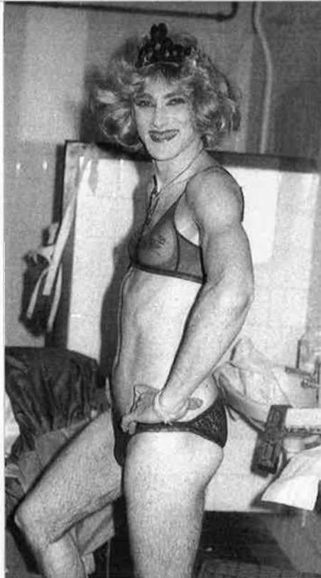
Riba, antisistema per vocació.