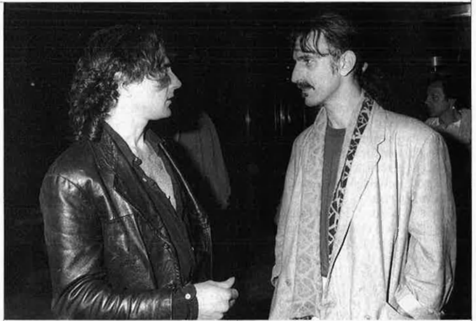
Pau Riba (en la foto amb Frank Zappa) va ser el pioner del rock'n'roll català.

Sis anys a l'illa, en què Pau Riba es converteix en un "petit personatge". Va fer de tot: cultivar l'hort, treure fem de les corts de porcs, nudisme, aprendre a llegir les estrelles, el tarot, la simbologia... I la música. L'etapa formenterera no va ser ni més ni menys activa que les altres: un disc, Jo, la donya i el gripau , enregistrat amb un aparell de piles amb ressonàncies 'tecnològiques' incloses: "fotíem un micro dintre un pou... i si ho escoltes bé, se sent el vent, les abelles, el mar, les ovelles...". També hi va compondre tres o quatre òperes inèdites. A més, anava a Barcelona a fer els bolos que li sortien. I en Pau Riba