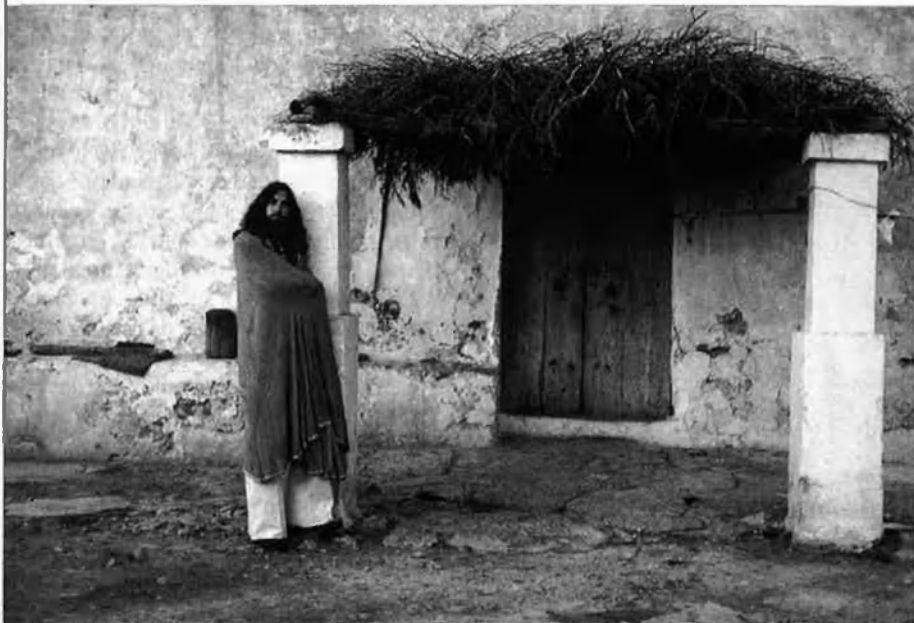
“Vivíem sota les roques, damunt els arbres... Hi havia centenars de hippies d'arreu del món”.

—Bé, i tu, ¿per què no t'has tallat els cabells?