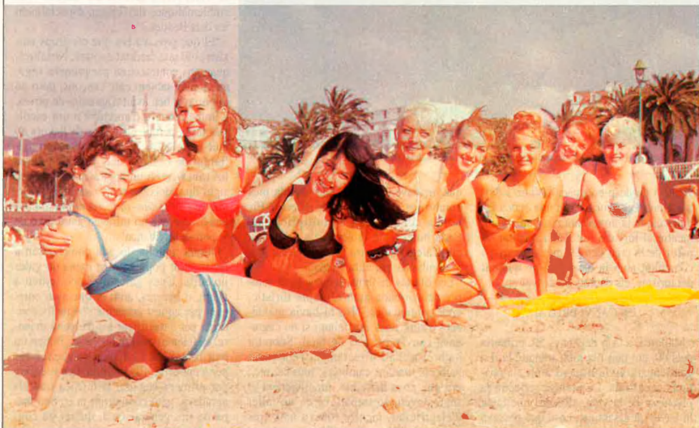
Les turistes canviaren, en cert aspecte, la joventut mallorquina.

La dècada dels seixanta significà per a Mallorca una vertadera revolució. Fou, però, una revolució molt diferent a la que es pretenia fer en el París de 1968. Antoni Morlà, músic, cantautor, fa ara un curs a la Universitat de les Illes sobre aquells anys que canviaren Mallorca