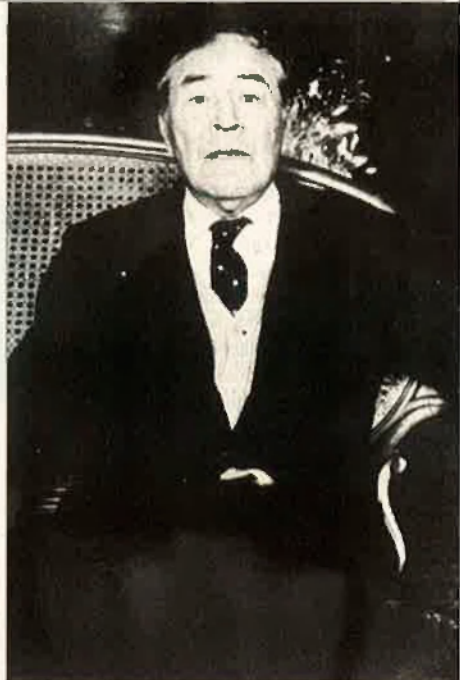
La mort de Josep Pla simbolitza el final anunciat dels "grans homes".

Pla i la fi de les patums: Pla és l'últim gran personatge. En realitat correspon ja a una altra època. Els grans homes s'han acabat, s'han extingit com els mamuts. No és malenconiós. No és cap pretensió. ¿On són els grans homes? Joan Fuster va optar per la marginació i la mandra. Quan va acabar-se el franquisme va córrer l'espècie que els calaixos dels artistes, dels escriptors, eren plens a vessar. ¿Què va sortir dels calaixos? No voldria ferir ningú, però sembla que Josep M. Espinàs potser hauria de ser un gran home; que Sagarra és una cosa i "el nen" tota una altra; que Manolo Vázquez Montalbán, que tinc en gran estima i que és un home d'una extraordinària