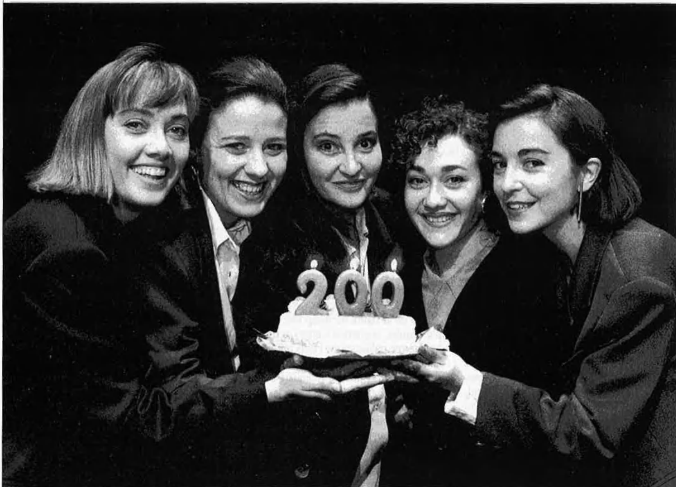
Quan T de Teatre va estrenar Petits contes misògins somniava a fer cinquanta representacions.