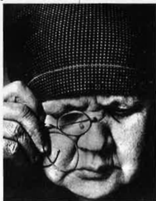
Aleksandr Rodtzenko, Retrat de la mare de l'artista . 1924.

tica, la qual, durant la nostra primavera i estiu, es deixarà veure a les sales d'exposicions tant de Barcelona com de València. Així, podrem disposar tant d'un repàs de la història soviètica a través del filtre fo-