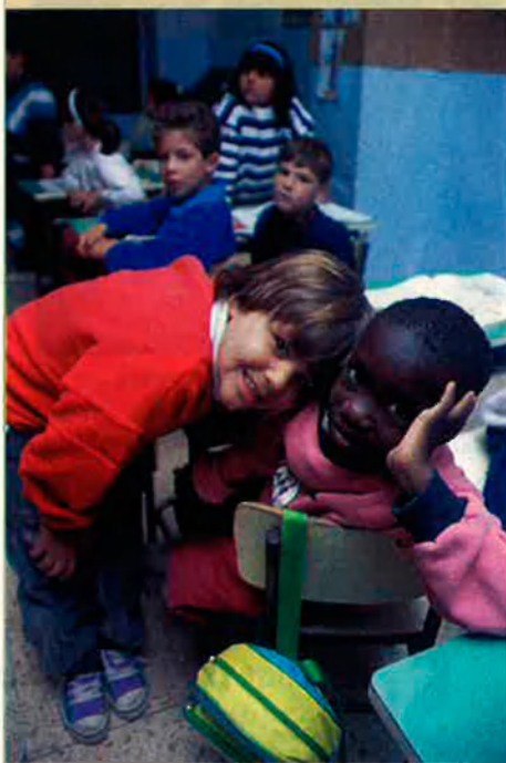
La majoria dels nens estrangers es concentra en els barris pobres de les grans ciutats.