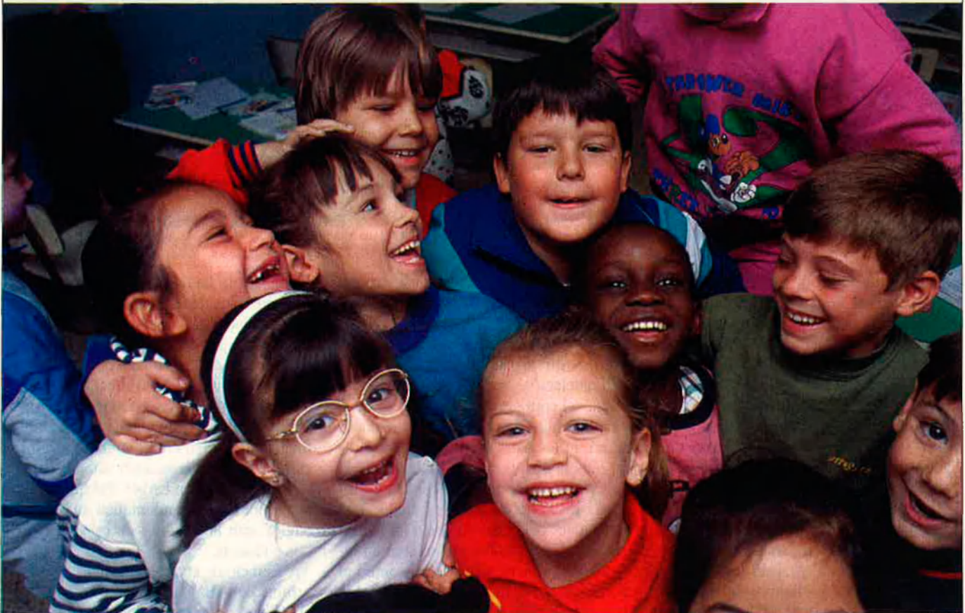
L'acceptació dels nens estrangers no-europeus a l'escola no es correspon amb el rebuig que existeix en el mercat laboral cap als joves de les mateixes nacionalitats.

L'augment de la immigració procedent dels països del Tercer Món ha obligat les institucions i algunes entitats privades a organitzar programes d'integració lingüística i cultural dels nous nens. Els nens viuen un doble risc de desarrelament entre el país d'origen i el d'adopció.