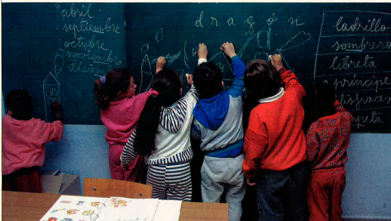
Més de 7.000 nens estrangers, procedents del Tercer Món, cursen estudis al Principat, per 1.700 al País Valencià.