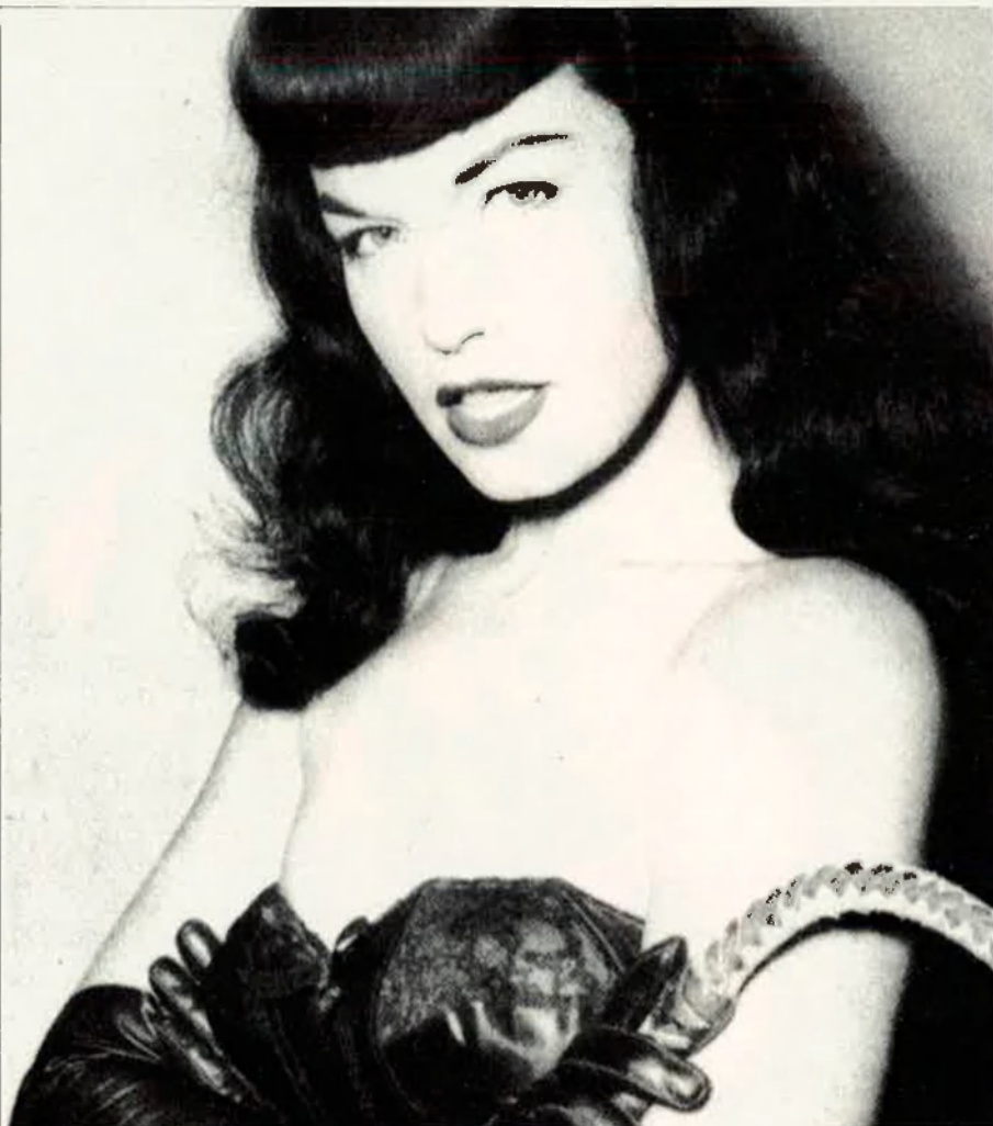
Malgrat que Betty Page volia triomfar d'actriu va acabar sent coneguda per les seues postals eròtiques.