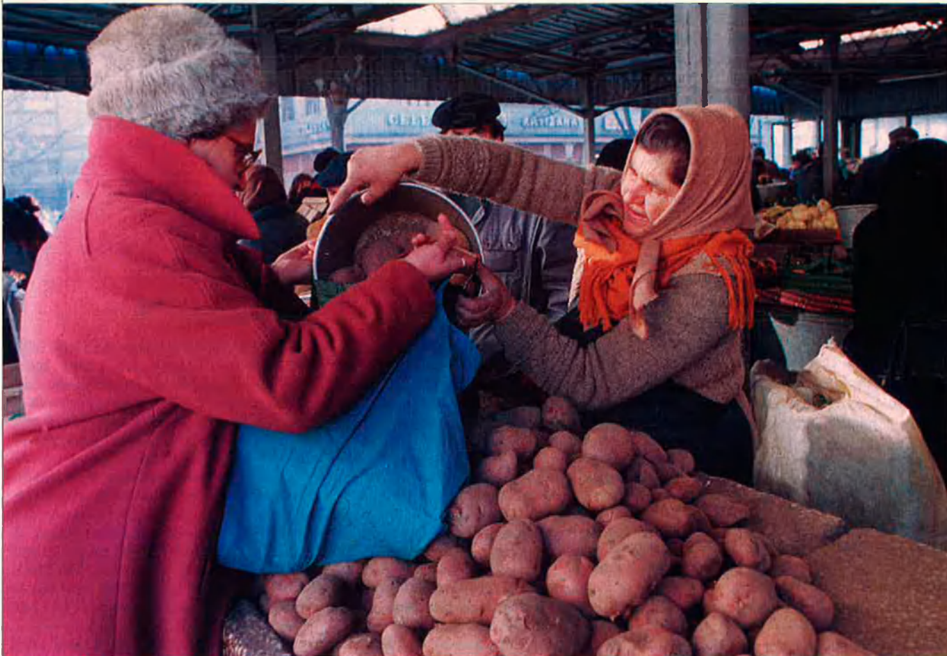
Amb l'economia de mercat, la vida diària dels romanesos no ha millorat gaire i fins i tot ha empitjorat en alguns sentits.