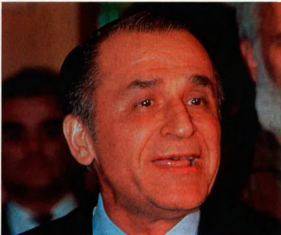
Ion Iliescu, ex-membre del Partit Comunista, és ara president de Romania.

Després de prendre part en la Segona Guerra Mundial en el bàndol feixista, ambdós països caigueren en l'òrbita de Moscou. Sòfia fou sempre un aliat extremadament lleial al Kremlin; Stalin fins i tot considerà la possibilitat de convertir Bulgària en república soviètica. En canvi, el règim de Nicolae Ceaucescu es distancià progressivament de la Unió Soviètica, arran de la invasió de Txecoslovàquia, si bé sempre es mantingué en la més rígida ortodòxia estalinista quant a economia. La revolució sagnant que féu caure el conductor romanès el desembre del 1989 con-