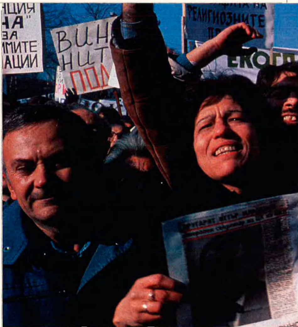
Les confrontacions polítiques internes i la difícil situació de l'economia pinten un panorama de conflictiu.

Les perspectives econòmiques globals a terme mitjà són esperançadores. Aquests països, amb una mà d'obra ben qualificada i barata que hauria d'atreure la inversió estrangera, disposen de recursos naturals (Romania té petroli), d'un gran potencial per a desenvolupar el turisme (esquí als Carpats de Romania, platges de la Mar Negra), d'una considerable riquesa agrícola i d'alguna especialització sorprenent en sectors d'alta tecnologia (en el cas de Bulgària, que aportà electrònica al programa espacial soviètic). Romania podria recuperar el seu paper de potència agrícola –sector que Ceausescu va pràcticament destruir per forçar la industrialització– un cop els nous sis milions de propietaris rurals, resultat de la privatització de la terra, puguin disposar de maquinària suficient. Bulgària és el primer país mundial productor i exportador, mesurat per càpita, de cigarrets. La pèrdua de llocs de treball d'un sector industrial hipertrofiat pot ser absorbida per l'encara deficient sector de