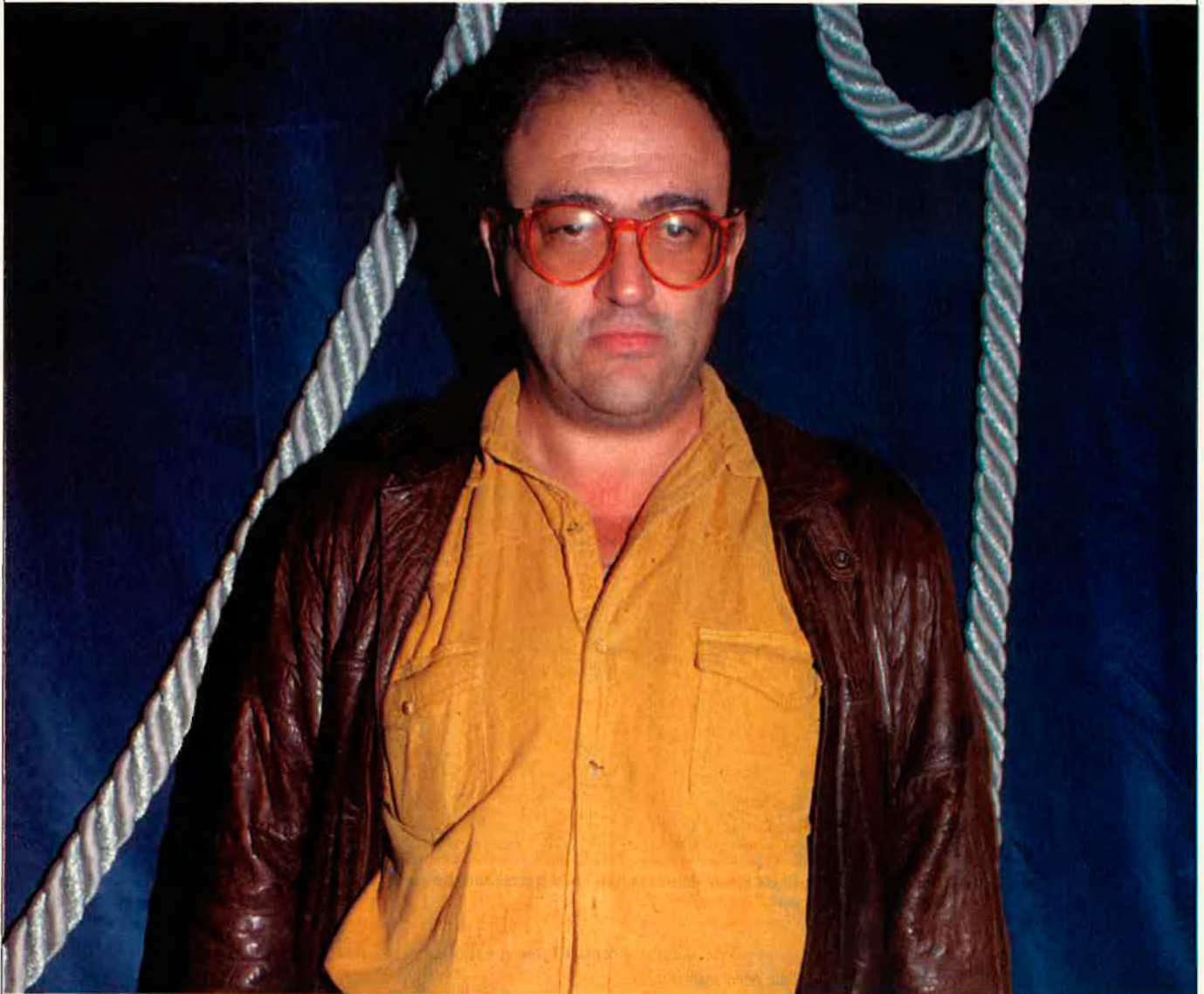
“Jo tampoc no sóc un gran seguidor de l'òpera; m'avorreix força.”