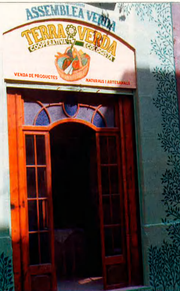
La dispersió i l'enfrontament entre les diverses sensibilitats de l'ecologisme català, fonamentalment pel tema del nacionalisme, fan difícil la unitat.