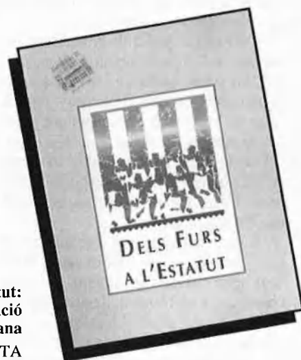
Dels Furs a l'Estatut: Actes del I congrés d'Administració Valenciana P.V.P. 5.000 PTA