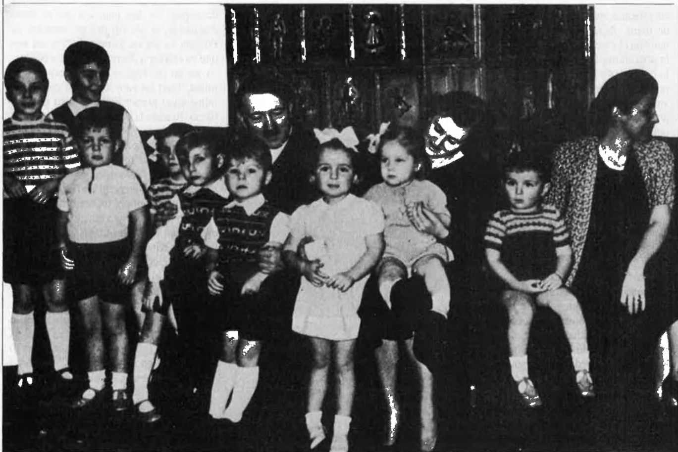
En companyia d'Eva Braun, Hitler celebra el seu aniversari rodejat dels fills dels seus dirigents. Era habitual que Hitler apadrinés molts d'aquests nens.