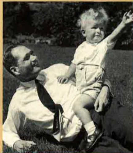
Rudolf Hess amb el seu fill l'any 1941.