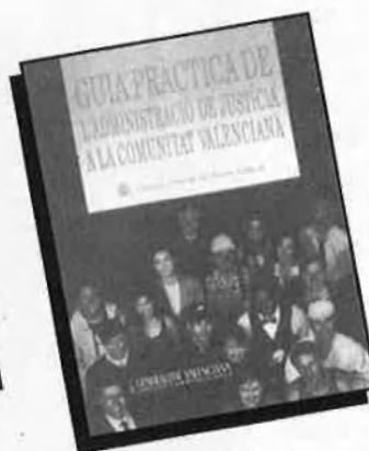
Guía pràctica de l'Administració de Justícia a la Comunitat Valenciana P.V.P. 1.000 PTA