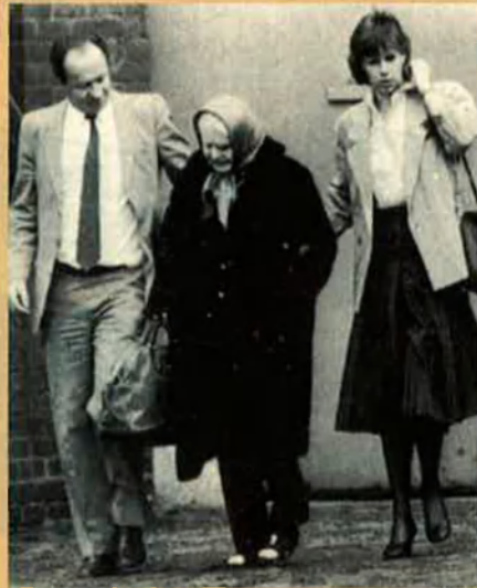
Wolf sortint de la presó acompanyat per la seva mare, l'any 1985.