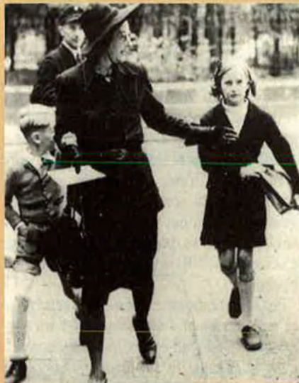
Niklas Frank amb la seva mare entrant a la presó de Nuremberg.