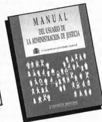
Manual del usuario de la Administración de Justicia P.V.P. 100 PTA