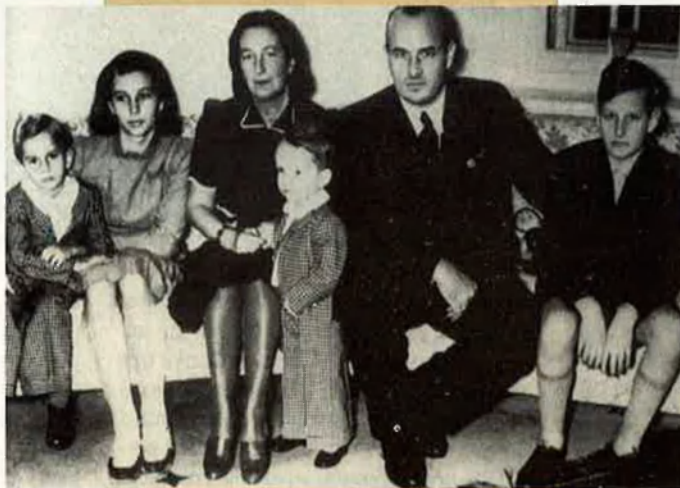
Retrat de la família Frank.