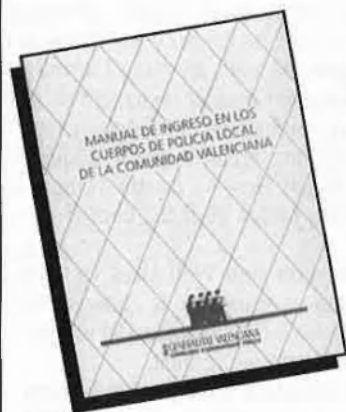
Manual de ingreso en los cuerpos de la Policía Local de la Comunitat Valenciana P.V.P. 1.500 PTA