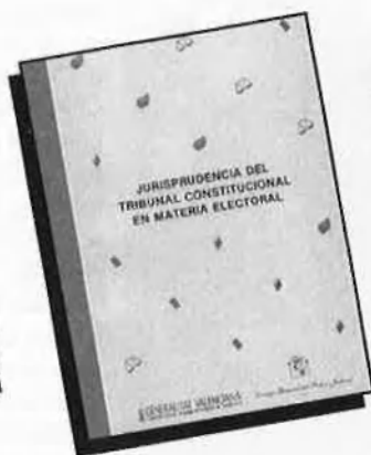
Jurisprudencia del Tribunal Constitucional en materia electoral P.V.P. 1.000 PTA