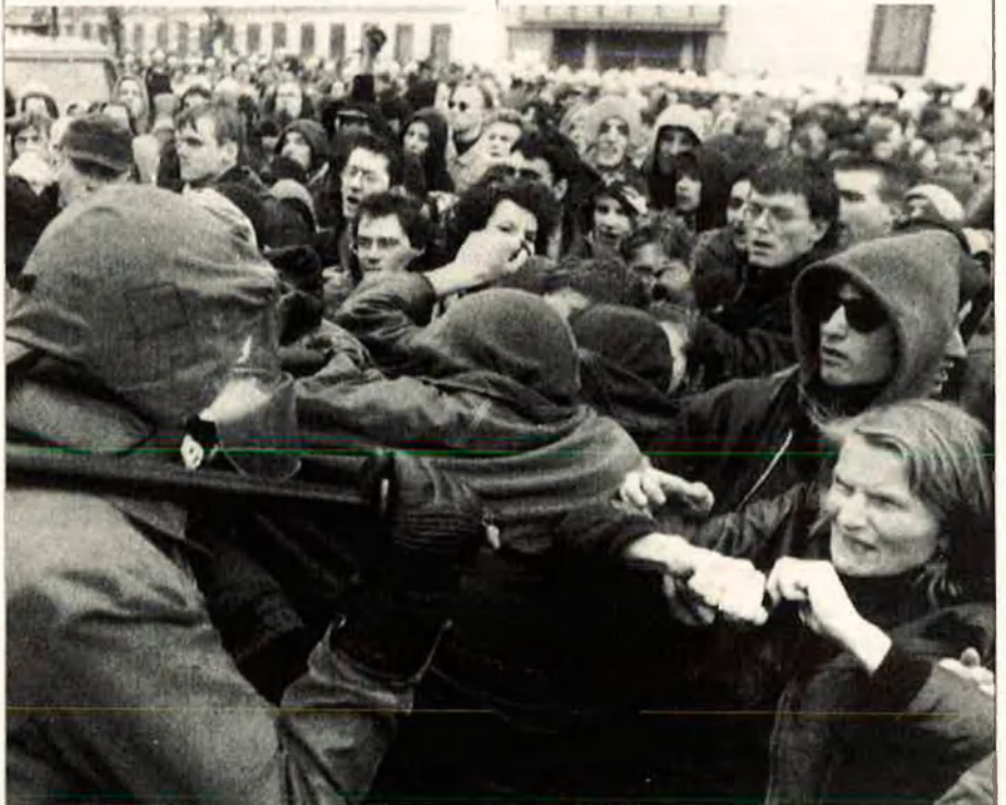
La manifestació contra la candidatura de Berlín del passat 18 d'abril va reunir més de 10.000 persones i va acabar amb alguns enfrontaments.