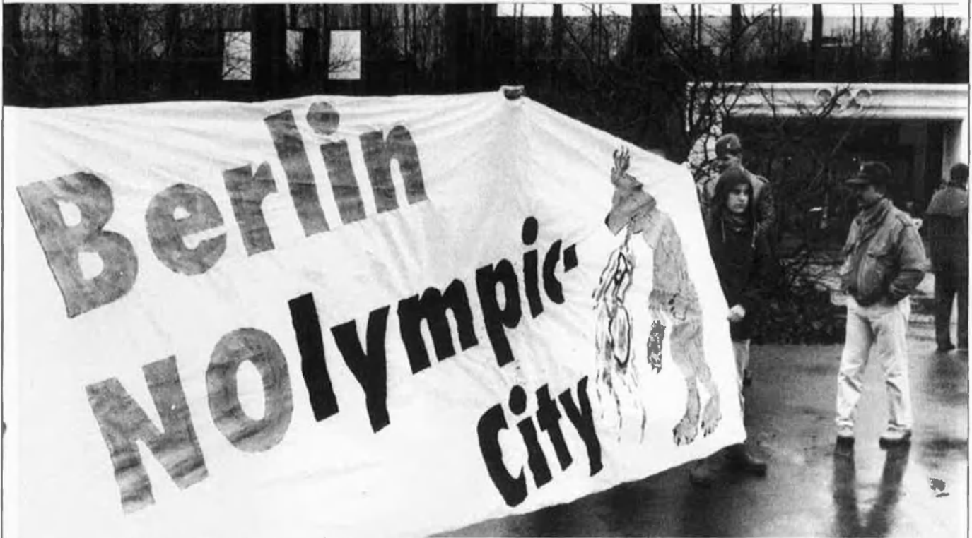
La candidatura de Berlín haurà de tenir molt en compte l'oposició que s'ha organitzat a la ciutat contra la celebració dels Jocs.