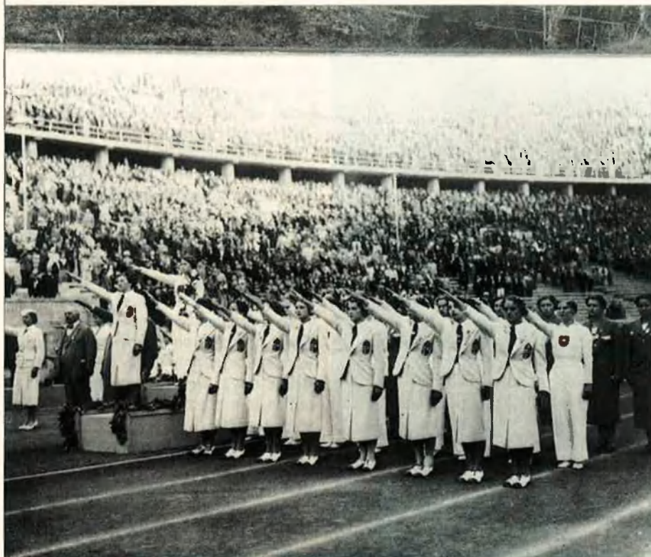
Berlín va ser seu olímpica l'any 1936, amb Hitler com a cap d'estat.