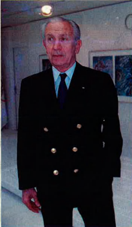
Samaranch estudia atentament totes les candidatures olímpiques per al 2000. RAFA GIL

D'altra banda, els empresaris olímpics, com ara Samaranch, no els convenç només la perspectiva de "celebrar una gran festa en un clima de tolerància", com diu Helmut Kohl. Els dubtes creixents dins del COI sobre la potencialitat econòmica d'un país que havia estat al capdavant de la indústria, volen esvaïr-los amb un