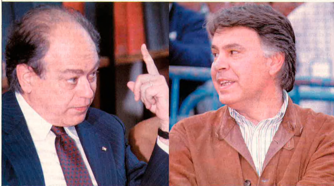
Jordi Pujol i Felipe González es poden trobar cara a cara després del 6 de juny.

Les travesses perfilen un escenari postelectoral en el qual CiU pot trobar-se en condicions d'haver d'optar entre mantenir la política de suport parlamentari puntual a la majoria o fer un pas més: corresponsabilitzar-se en una acció de govern. Una decisió difícil que té un preu.